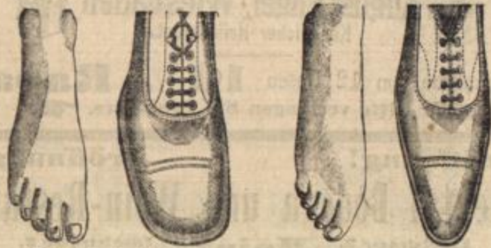
Natürliche Fussbildung, welche beim Tragen von Reform-Façons erhalten bleibt.