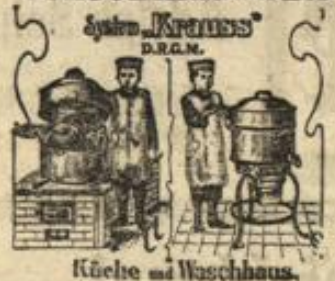
Küche und Waschhaus.