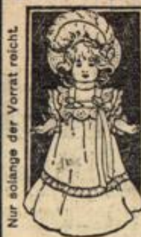
Nur solange der Vorrat reicht.