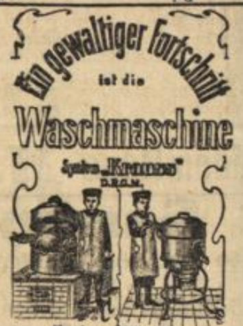
Küche und Waschküche.

Telephon 2078. Netzstrasse 22. Ph. Krämer