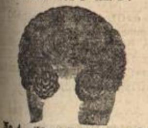
No. 4. Künstl. Vorderfrisur, sehr klein u. bequem, v. 12 Mk. an.