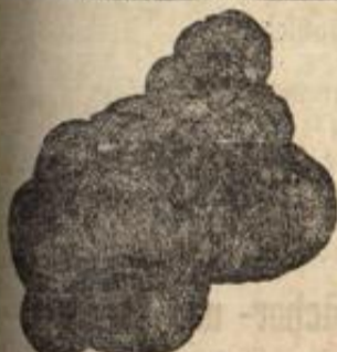
No. 1. Vollständige Damenperücke von 4 Mk. an.

Eine Grube Pferdeweiß billig abg. Michelstr. 21.