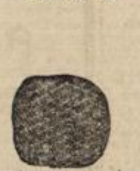
No. 10. Haarputzen aus einer Puffe und herumgelegtem Zopf zum Selbstaufstecken, St. 1.50 Mk. von 10 Mk. an.