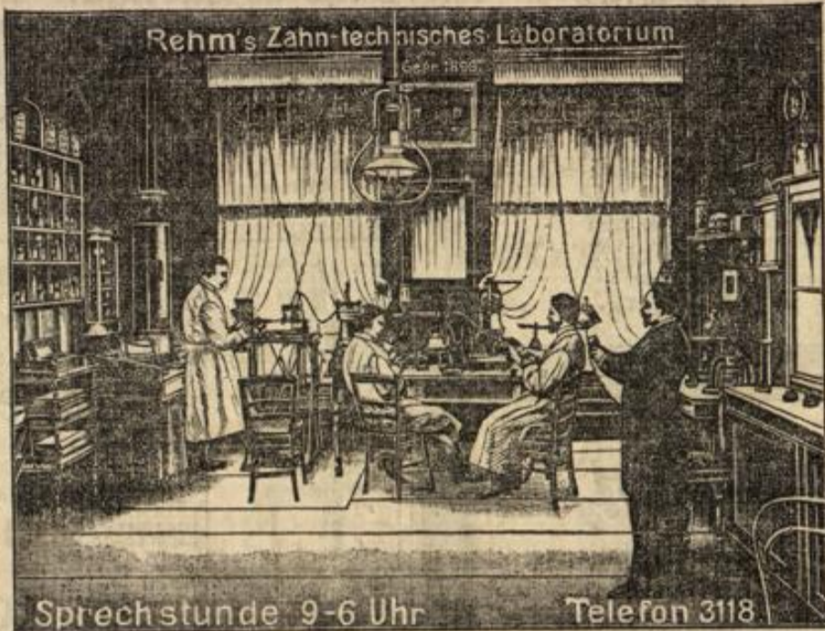
Rehm's Zahn-technisches Laboratorium