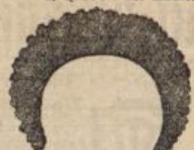
No. 11. Hygienische Haarunterlage mit Deckhaar, bei dünnem Vorderhaar anzuw., v. 4 Mk. an.