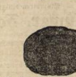
No. 8. Haarputzen aus extra langem Haar 20 Mk.

Die hier getroffenen Abbildungen, welche bei schwachem Haarwuchs zur jetzigen modernen Frisur unentbehrliche Hilfsmittel sind, ermöglichen es auch den Damen ausserhalb Wiesbadens gegen Einsendung einer Haarprobe und Angabe der gewünschten Nummer, dieselben von mir durch die Post zu beziehen.