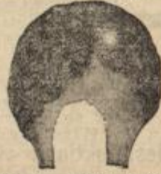
No. 3. Damenscheitel, 20-30 Mk., je nach Grösse u. Qualität der Haare.