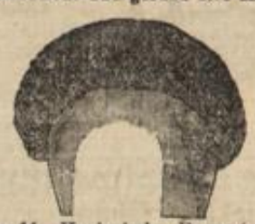
No. 9. Haarputzen aus einer Puffe und herumgelegtem Zopf zum Selbstaufstecken, St. 1.50 Mk. von 10 Mk. an.