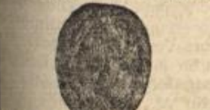
No. 6. Haarputzen aus einem verschlung. Theil v. 4 Mk. an.