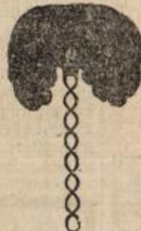
No. 12. Lökchen an Draht aus kreuzem Haar, zur Ergänzung No. 6. Hygienische Haarunterlage auf Hohlgestell gearbeitet, sehr leicht und gesund 2.75 Mk. & Paar 8 Mk.

Die hier getroffenen Abbildungen, welche bei schwachem Haarwuchs zur jetzigen modernen Frisur unentbehrliche Hilfsmittel sind, ermöglichen es auch den Damen ausserhalb Wiesbadens gegen Einsendung einer Haarprobe und Angabe der gewünschten Nummer, dieselben von mir durch die Post zu beziehen.