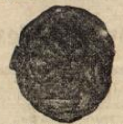
No. 7. Strähne ohne Kordel, 60 cm lang, von 8 Mk. an.