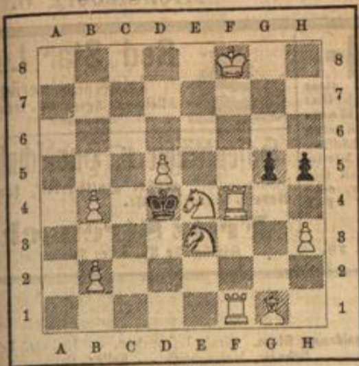
Matt in 3 Zügen.

Von Franz Dedrie in Brünn. (Für die „Wiener Schachzeitung“.)