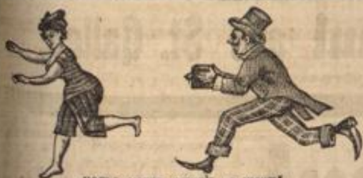
HOELA, VATER, SIEHT'S JA NICHT!