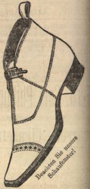
Beachten Sie unsere Schaufenster!