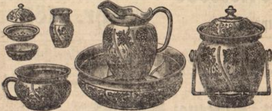
empfehlen in grösster Auswahl

in wunderbarer Ausführung, von Porzellan fast nicht zu unterscheiden,