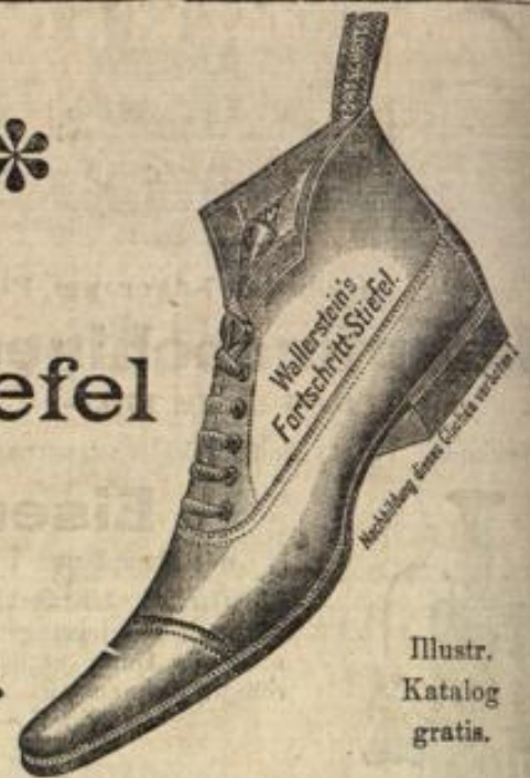
Illustr. Katalog gratis.

Neustadt's Schuhwarenhaus, Langgasse 9. Wiesbaden, Telefon 3051.