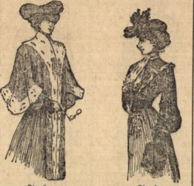
Fig. 3. Fig. 4.

Die Muffe sind entgegen allen Prophezelungen nicht viel größer geworden. Elegante Muffe und Hüte, beson-