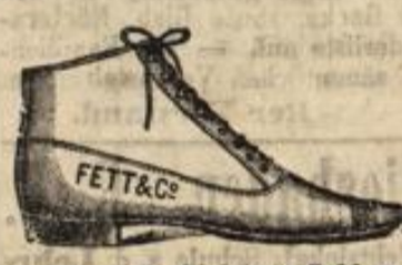
Herren-Damenstiefel von 5.00 an.

Zwei große Gelegenheitskäufe für Damen! Damen hochlegante Chevr.-Schnür- u. Anoystiefel für . . . 7.90 Damen leichte Reiseschuhe mit Polster ohne Rahm für . . . 0.95 Bitte die Schaufenster in der Goldgasse, Ecke Langgasse, zu beachten.