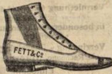
Herren-Zugstiefel von 4.50 an.

gewähren wir, jedoch nur diesen Monat auf sämtliche besseren Schnürschuhe für Damen.