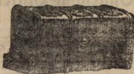
D. R. Patent No. 111767.