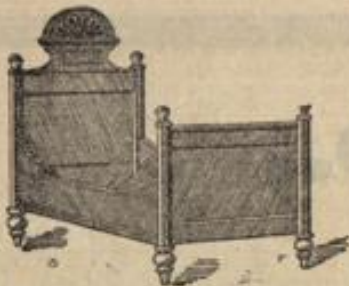
Schweres Holzbett, fein Nussbaum-lackirt,