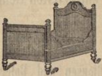
Solides Holzbett mit hohem Haupt, fein Nussbaum-lackirt,