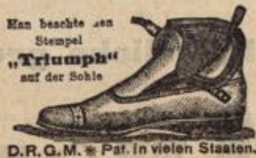
D.R.G.M. * Pat. in vielen Staaten.

Der praktischste u. bequemste Stiefel für Herren und Damen, mit einem Druck zu öffnen und zu schliessen.