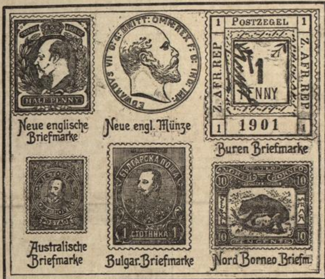
Neue englische Briefmarke

schon manchen argen Buff ausgehalten, ob es aber die Herrschaft der Anhänger des Kaiser- und Königthums, der Merikalen und der boulangistischen Gruppen zusammenzutragen könnte, das will ich doch dahingestellt sein lassen. Es ist ja richtig, in Frankreich könnte Manches anders sein, als es ist, aber welcher Staat hätte nicht ähnliche oder andere Mängel? Die Republik hat sich bis heute lebenskräftig erwiesen; dies wird auch ferner der Fall sein, wenn ihre Entwicklung nicht im nationalistischen Sinne gehemmt oder zerstört wird.