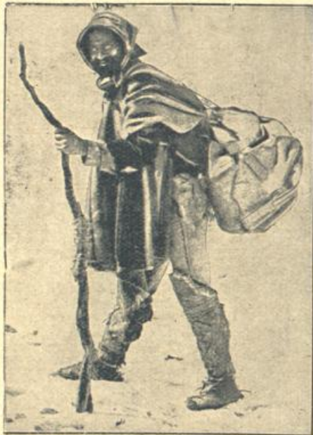
Ein Briefträger in den Cordilleren.

Erwin wollte sich erheben. Doch ging es nicht. Seine Glieder waren wie von Blei und verharrten vollständig in ihrer Lage. „Aber das ist doch dumm“, murmelte Erwin, „wie kommt es nur, daß ich mich gar nicht mehr bewegen kann?!“