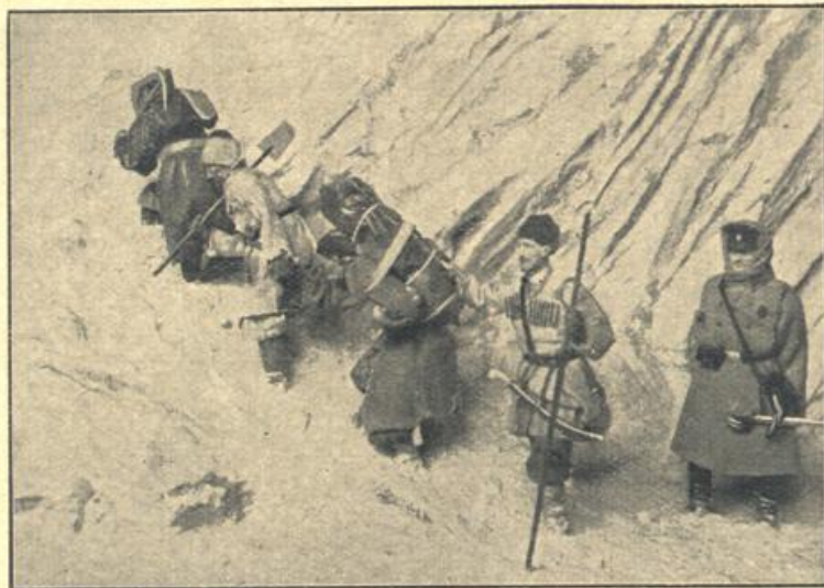
Ein Brieftransport im russischen Uralgebirge.