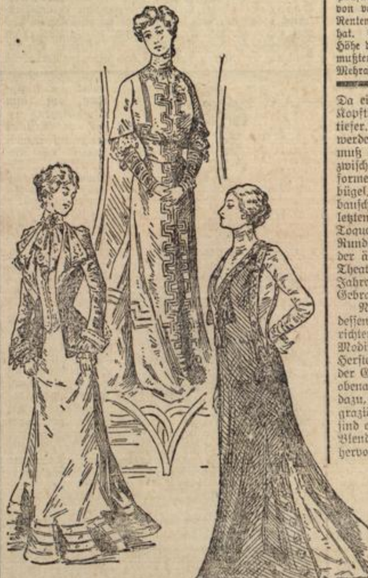
Skizze 2. Gesellschafts-Toilette mit Schoofhaite im Genre Louis XVI. Skizze 3. Toilette mit Sammetband und Fell-Garnitur. Skizze 4. Gesellschafts-Hut in Prinzessform.