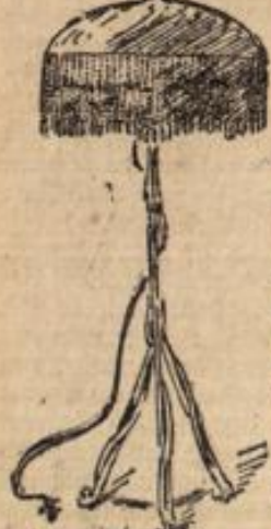
Skizze 5. Lampenschleier aus Perlen-Arbeit.

Abgehen den Total-Eindruck prüft. Mag der Gut auch noch so reizend das Gesicht umrahmen, wenn er zur ganzen Gestalt zu groß, zu klein oder zu mässig wirkt, wird der ganze Eindruck verdorben. Die wenigsten Damen wissen, welchen Gesamteindruck sie auf der Straße machen in Gang und Haltung, sonst würde z. B. manche mit nippendem Gang nickende Federn oder Blumen auf dem Hute vermeiden, die die leichte Angewohnheit ins Groteske steigern können.