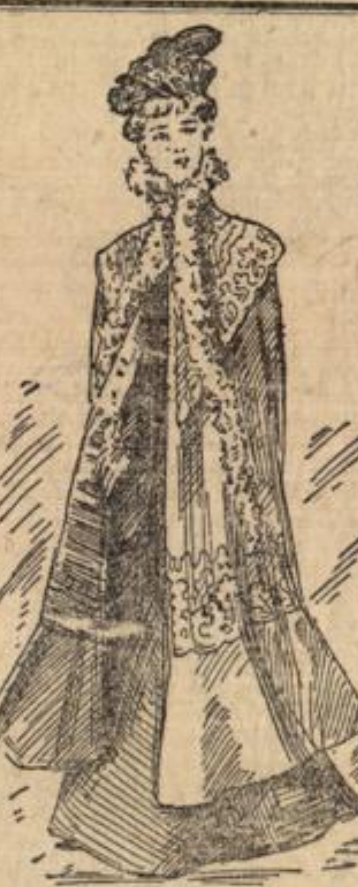
Skizze 6. Langes Cape mit Westentellen.

An dem Frauen-Cape, Skizze 6, bildet zu schwerem schwarzen Wollreps Seidenreps Shawl-Kragen und Besatzstreifen, die je mit Seiden-Soutache aufgesteppte Applikationen aus dem Oberstoff zeigen; dazu geübt sich