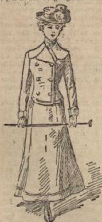
Skizze 1. Winter-Kostüm für Mädchen von 14 bis 15 Jahren.

Berlin. — Auffallend an den neuen Winterhüten sind in erster Reihe ihre breiten, flachen Formen, die wohl schon in der vergangenen Saison in Erscheinung getreten waren, jetzt aber die allein herrschende Mode bilden. Die Vorliebe für das Flache geht soweit, daß an vielen Hüten der sonst schon minimale Kopf ganz fehlt, so daß die Oberfläche eine Scheibe ist, die häufig gar keine Garnitur, oder nur flach eingestechte Federn aufweist. Auch die Doppelkrempe ist keine eigentliche, — der Hut bilden zwei mehr oder weniger gebogene Filzplatten, deren untere den Ausläufer für den Kopf erhält, während an der oberen, wenn sie nicht ganz flach bleibt, ein leicht gefalteter Kopftheil geformt wird. Ein charakteristisches Modell dieser Art fügt die „Modenwelt“ und „Illustrirte Frauen-Zeitung“ (Berlin, Franz Lippert-Verlag) ihrem interessantesten Bericht in der Nummer vom 15. Oktober 1901, dem wir diese Ausführungen entnehmen, unter „Hüte und Hut“ mit Abbildungen 55 und 56 bei. Wichtig für den Sitz des Hutes ist die Frisur.