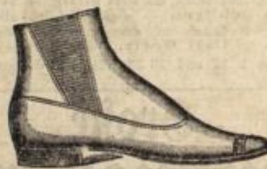
Herren-Zug- und Hakenstiefel in erprobt. gutem Leder. 6.75.