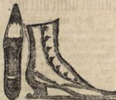
Damen-Knopf- u. Schnürstiefel in vorzügl. Chevreau, warm gefüttert, . . . . . 9.75.