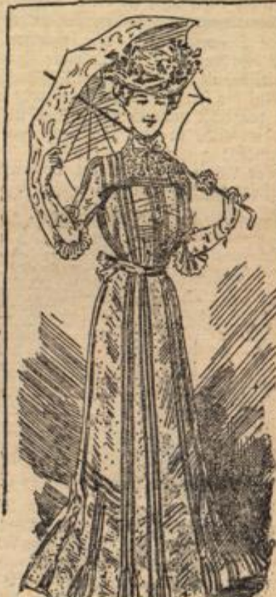
Skizze 5. Kleid mit Postenträger.

Knopfstiefel praktisch, Festkleider verlangen eleganteres Schuhwerk: ganz weiße Stiefel, sowie weiße mit schwarzem oder braunem Lackleder-Bezug; neu sind Stiefel aus