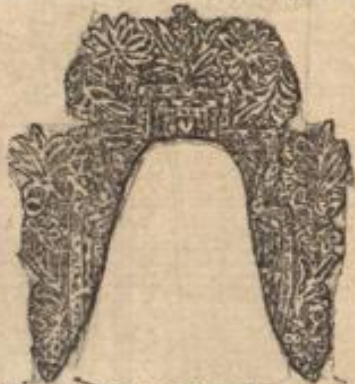
Skizze 1. Garnitur-Tragen. Illustration von Hans Spitz

Vor Allem, ungenüthet des Sommers, muß man ein tadellofes, dunkles Wollkleid besitzen, das den Regen nicht