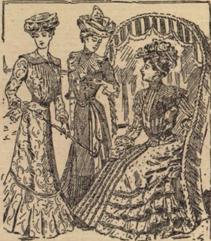
Skizze 2. Blusenkleid mit kleinem Ausschnitt.

wichtige Rolle für den Gesamteindruck der kindlichen Kleidung spielt auch das Schuhwerk. Zur Alltagsstracht sind die bekannten braunen und gelben Schnür- oder