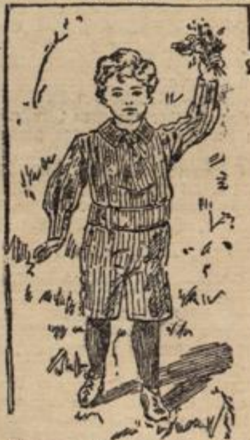
Skizze 1. Waschanzug für Knaben von 3 bis 4 Jahren.

Die Haartracht der Kleinen und größeren Mädchen erscheint viel mehr als in den letzten Jahren hängend und frei. So trägt Mädchen neben den um den Kopf gelegten Kleidern Defregger-Häpsern vielfach ihr gut ge-