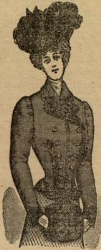
Jaquetts, schwarz und farbig. 4 1/2, 6, 8, 12 Mk.

verkaufen wir von heute ab unsere grossen Lager-Bestände in