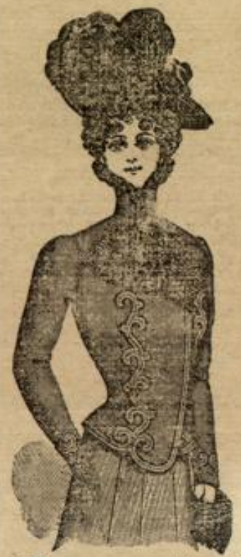
Jaquetts, prima Stoffe, beste Verarbeitung. 14, 18, 21, 25 Mk.

Das Allerneueste dieser Saison ganz enorm billig.