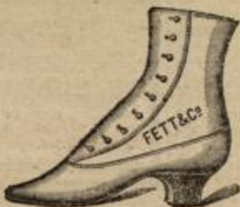
So sehen untengenannte Damen-Stiefel aus.

Ein amerikanischer Stahlring. Man meldet aus New-York: „Unser Eisen- und Stahlmarkt hat sich seit einiger Zeit insofern unter einer allmählich unerträglich werdenden Spannung befunden, als die lebhafteste Konkurrenz und das leider so häufige Preisdrücken unter den amerikanischen Fabrikanten und Händlern einen allgemeinen Rückgang der Preise für die fertigen Produkte androhten, obwohl hierfür in Anbetracht der sonst überaus günstigen Marktverhältnisse gar keine andere Ursache vorliegen konnte. Jetzt haben sich die grössten und bedeutendsten Stahlproduzenten des ganzen Landes zusammengesetzt und sind im Begriff, einen Ring unter sich zu bilden, der die Preise auf der gebührenden Höhe halten soll. Einzelheiten über diese wichtige Vereinbarung verlaufen noch nicht, aber es steht bereits fest, dass der Durchschnittspreis für Stahlplatten auf 27 Dollars für die Tonne und für Bandstahl auf 20 Dollars für die Tonne fixirt worden wird, was eine Erhöhung der augenblicklichen Notirungen von ungefähr 10 v. H. bedeuten würde. Man ist überzeugt, dass der Ring bereits jetzt stark genug ist, um mit seinen Absichten durchdringen zu können.“