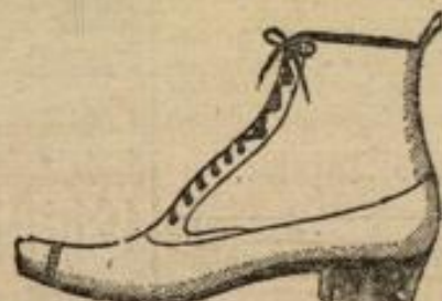
So sehen untengenannte Herren-Stiefel aus.

Wir haben einige größere Vorräte feinerer Schuhwaaren, darunter die schönsten Reifemuster, als Gelegenheitskauf weit unter dem Herstellungspreis erworben und bringen diese von jetzt ab zu Preisen zum Verkauf, die mit Rücksicht auf die hervorragende Qualität der Waaren sicher ganz besondere Beachtung finden werden.