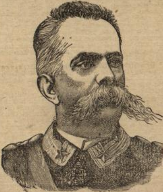
Der ermordete König Umberto.