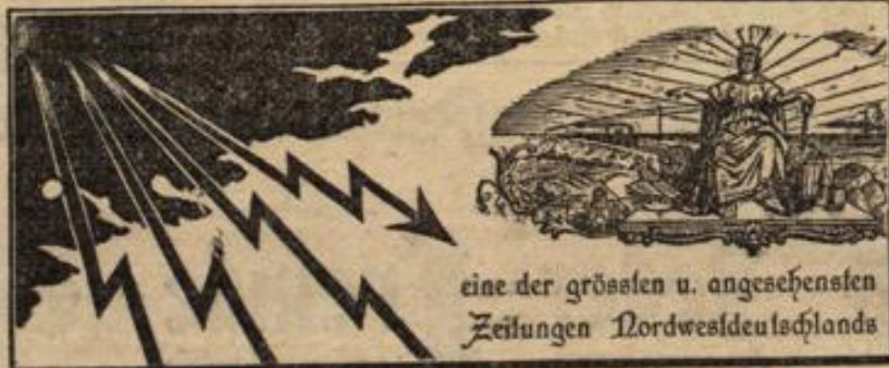
eine der grössten u. angesehensten Zeitungen Nordwestdeutschlands