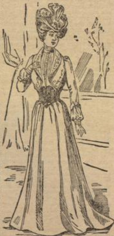
Toilette v. d. Pariser Weltausstellung.

Paris: Die Weltausstellung dieses Jahres, scheint mit ihrer glänzenden Toiletten-Heerschau wirklich die prophezeite Revolution der Mode zu bringen. So zeigt die nebenstehend abgebildete Ausstellungs-Toilette einer eleganten Pariserin zu dem auf den Hüften eingekrauschten Rock und den charakteristischen Pausch-Kärmeln der Wiedermaierzeit den hochmodernen Bolero mit Wiedergürtel und