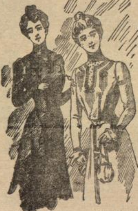
Schneidertisch mit überstreichendem Schluß. Kleid mit schmaler Paffe.

oder Bolero mit Chemise verarbeitet und suchen, wo sie nicht das reine Weiß bevorzugen, durch häßliche Farbstellung zu wirken. Fraisefarbener oder papierblauer Panama erhält Neuwerk und fingerbreiten Vorstoß um den Bolero- rand aus schwarz-weiß gestreiftem Bique, der sich am