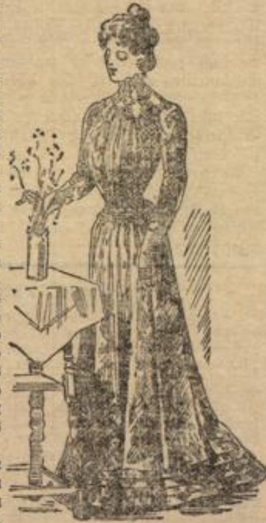
Foulard-Kleid mit Panerrock und neuem Kermel.

Damit der Gesamteindruck ein eleganter bleibe, soll den Unterkleidern und der Ausstattung des Kleiderrocks mit Seidenfutter und Spitzen-Palaysse erhöhte Aufmerksamkeit zugewendet werden. Hauptächlich wird diese Verkürzung den düstigen Sommerkleidern zu Gute kommen, denen ihre Frische dadurch länger erhalten bleibt. Die weichen, mit Volants und Spitzen ausgestatteten Dessons sind hier ja selbstverständlich, und auch das raschelnde Unterkleid braucht nicht entbehrt zu werden angesichts der ausgesprochenen Vorliebe für farbige Unterzüge unter jedem durchscheinenden glatten oder gemusterten Stoff, heiße er Grenadine, Gamine, Organdy oder