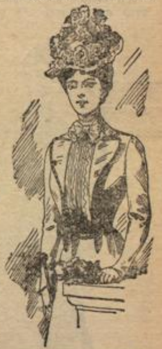
Jacken-Kostüm aus Veau, Runder Hut mit Rosengarnitur.

Der höchste Ausdruck sommerlicher Leichtigkeit wird mit dem weichen Mullkleid, — glatt oder brochirt, — über farbigen Unterkleide erreicht, dessen Gürtel und Kragenvorstoß man gern wieder von jenem absteckend, z. B. goldgelb oder lila zu Rosa und Blau wählt. Seinen vornehmsten Schmuck bilden, neben Weißstickereien und Spitzen-Gin wie Aufsätzen (Balenciennes oder Guipure), strohhalmbreite abgesteppte Bifensalten (Lingerie-Falten), welche die obere Rockweite einschließen und beliebig Vorder-, Rückentheile und Kermel bedecken. Außerdem ergeben die in Mull oder Batist ausgeführten Lingerie-Falten, häufig von schmalen Spitzen oder Ginfäden begleitet, auch für Kleider aus leichter Seide und Organdy viel begehrte, selbständige Besatztheile in Gestalt von durchbrochen eingefügten Einsätzen, hoch gestellten Carreaux, runden Passen, Noverd und Kermel-Manschetten — ja sie bilden, durch Weißstickerei oder Spitzen ergänzt, große runde, bisweilen den Hals etwas freilassende Kragen.