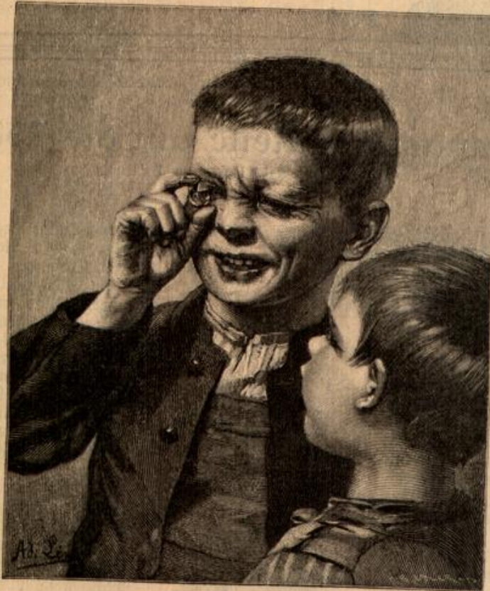
Das Frisma. Nach einem Bilde von Ad. Lira.