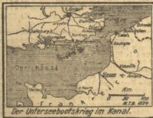
Der Unterseebootskrieg im Kanal.

Berlin, 26. Febr. (Str. Bl.) Die holländische „Tijd“ stellt laut „A. T.“ fest, daß die Liste der nach dem 18. Februar auf Minen gelaufenen oder torpedierten englischen Schiffe 20 Namen umfaßt.