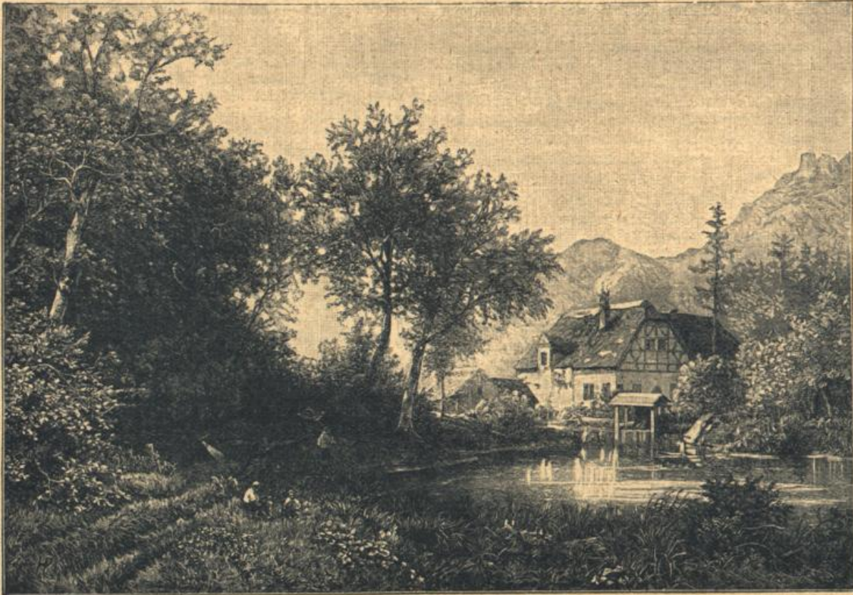
Am Mäblfeld. Nach dem Gemälde von B. Doble.

raum auf, eine Wand aus dürrerem Reisstrohgeflecht, die quer vorübergezogen ist, schimmert durch, und man kann hinten die Szene in gedämpfter Beleuchtung sehen; öfter ist gerade ein hitziges Gefecht im Gange, Gestalten schießen durcheinander mit jener unheimlichen Taktik und Behendigkeit,