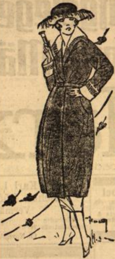
Dieser Mantel kostet Mk. 295.—

ist unser Lager zur Zeit ausgestattet. Nachstehend nur einige wenige Beispiele unserer Preiswürdigkeit: