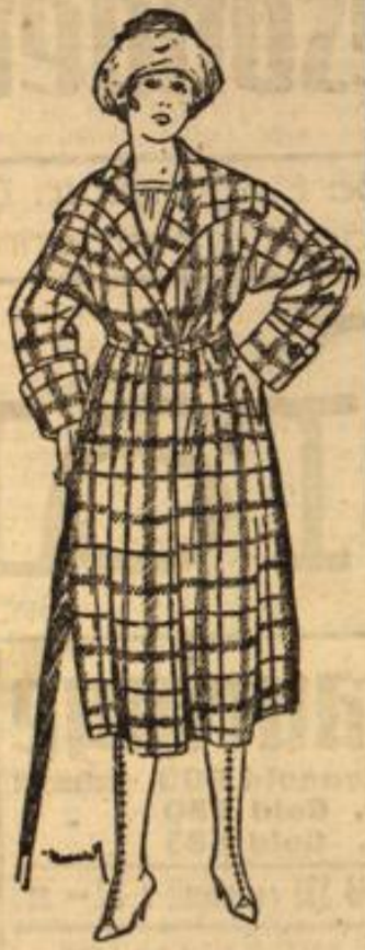
Dieser Mantel kostet Mk. 245.—

Kostüm-Röcke mod-rne Fasson 69, 58, 39 50 , 19 25 mit Plissee 475, 375, 245, 169