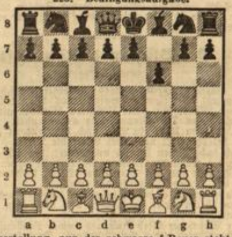
Anfangsstellung, nur der schwarze f-Bauer steht auf f6.