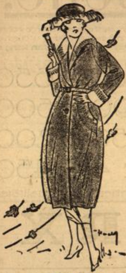
Dieser Mantel kostet Mark 295.—

beweist uns aufs neue unsere grosse Leistungsfähigkeit in bezug auf Auswahl und billigste Preise, worin wir als Grösstes Spezialhaus am Platze unerreichtbar sind.