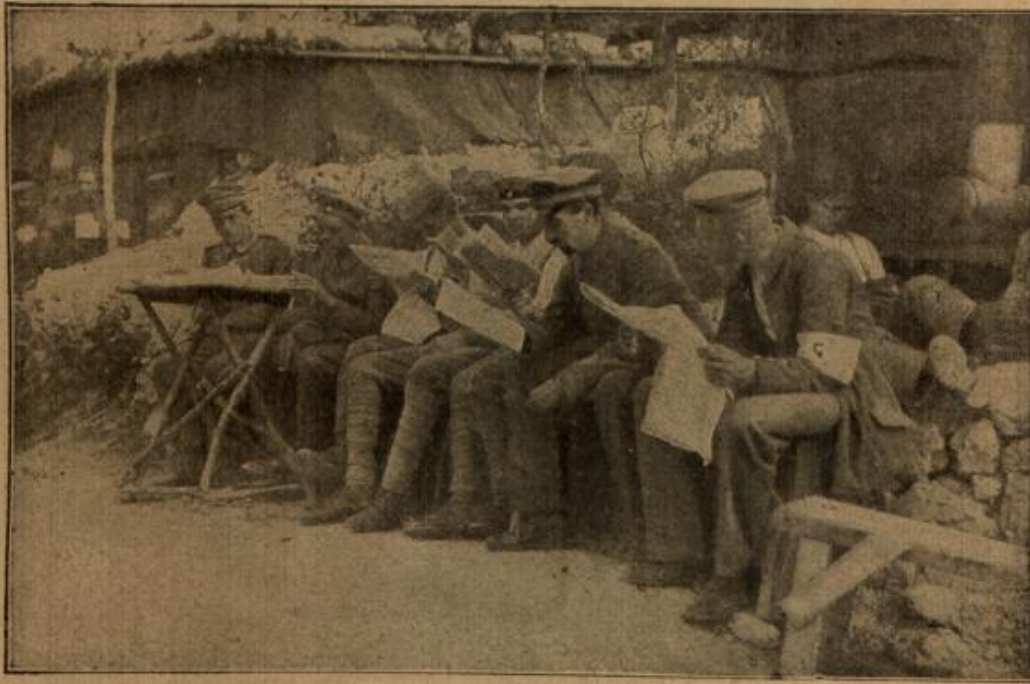
Deutsche Soldaten beim Lesen der neuesten Nachrichten während einer längeren Kampfpause.

wohl nicht mit der Raucherzeugung bei Waldbränden zu vergleichen ist, weil die Rauchwolke einer jeden einzelnen Granate schnell vorübergeht und nur auf engen Raum begrenzt ist. Ni. mals konnte Dr. v. Franz im Westen einen mit Rauchteil-