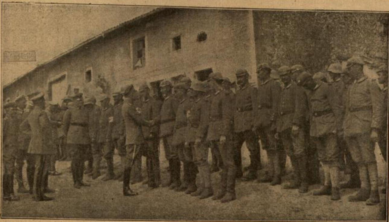
Der deutsche Kronprinz bei seinen Soldaten. Vorstellung derjenigen Soldaten des Regiments, die sich in den letzten Kämpfen besonders ruhmreich ausgezeichnet haben.

Im Schweizerhof kamen ihnen die Eltern entgegen. Frau Randow weinte laut auf und überschüttete ihre Tochter mit Vorwürfen, so daß der Oberkellner als Vertreter des Direktors herantrat, um sie zu ersuchen, in Rücksicht auf die späte Stunde ihre Stimme zu dämpfen.