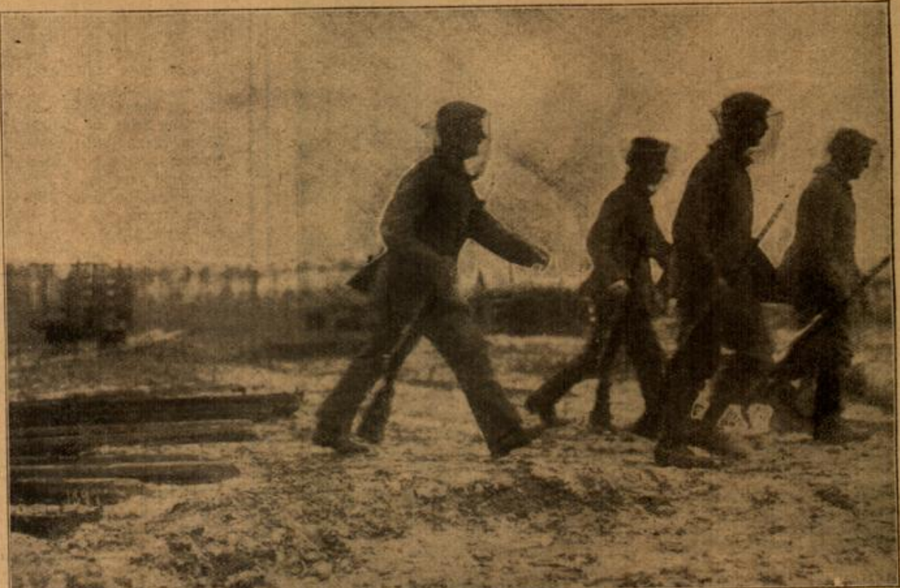
Deftlicher Kriegsschauplatz: Horchposten ziehen auf in Mückenschleiern.

Die Traubekur gestaltet sich häufig zu einer Entziehungsdiaät. Aus diesem Grunde erscheinen üppige Mahlzeiten mit schweren Weinen durchaus nicht am Platze. Es ist keineswegs zu vereinen, auf der einen Seite Blut und Säfte durch eine Traubekur zu reinigen, und auf der anderen, durch Fleisch- und Alkoholgenuß zu verschlechtern. Auch soll man Hülsenfrüchte,