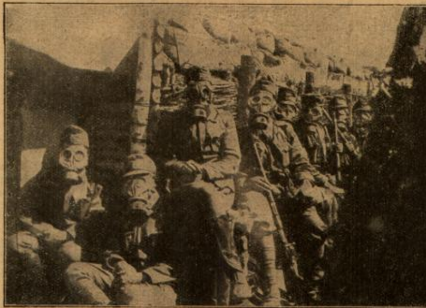
Oesterreichisch-ungarische Mannschaften mit Gaschutzmasken in Gefechtsbereitschaft.

An jedem Aste hängt ein kleines Glöckchen und klingt, fein, silbern. So ganz anders, wie arme Sünderglocken. Feierlich — schön. Sie nennt sie die Ehrenglocken. Es ist jede Glocke einem Toten gewidmet, einem, der sein Leben in diesem Lazarett ausgehaucht hat. Klärchen — bist du einmal schön heute... Emil, wer schrie denn eben so scheußlich? Hat nicht eben jemand kommandiert: Kompanie, Feuer! — — — Du, Emil, das ist Rolf Günther gewesen... Da stürmt...“