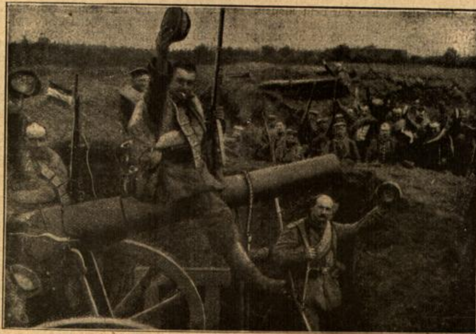
Deutsche Infanterie in eroberten feindlichen Geschützstellungen.

Es war nach Schluß des Arbeits- tages, als die eigentliche Feier ihren Anfang nahm. Der Inspektor sah stumm in seiner Ecke und starrte vor sich nieder. Die kleine, beweg- liche, weiß- haarige Frau aber, der die Herzengüte aus den kind- lich blauen, reinen Augen schaute, legte die Rechte an das Bild und redete, als sei es der rot- wangige, knabenhaft fröhliche Enkel