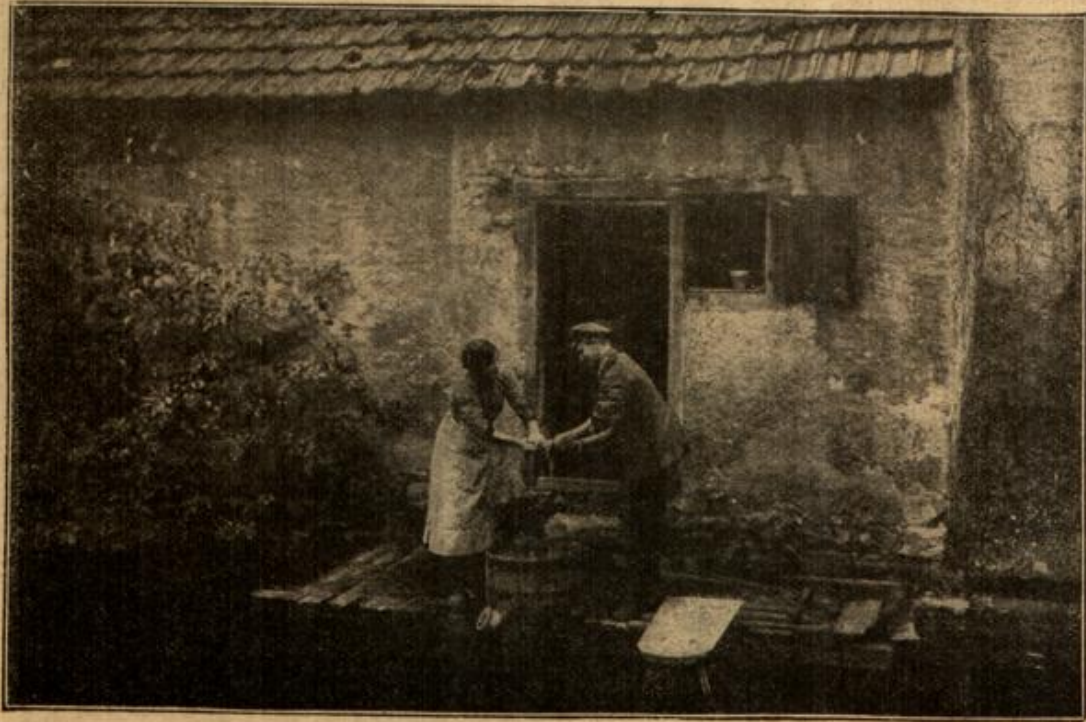
Die feldgraue Stütze.