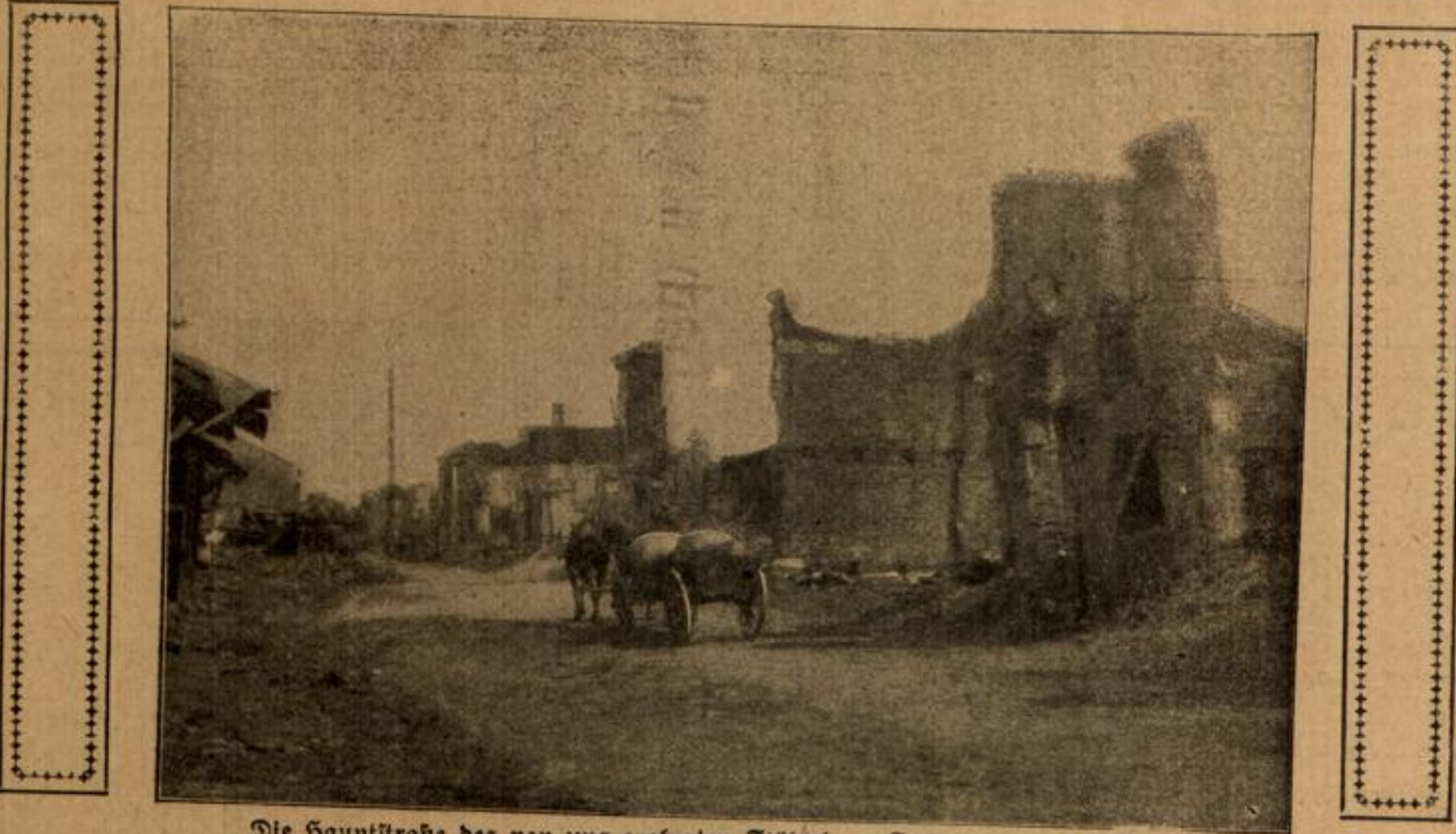
Die Hauptstraße des von uns eroberten Städtchens Sorigono an der Bzura.

Spinnen und setzte sie in ein Gläschen, das er mit Watte abschloß. Dann goß er vorsichtig einen Tropfen der Schafmilch — es gab nur solche — in das Gläschen und beobachtete nun im Halbdunkel. Schon nach einer halben Minute sah die Spinne am Rande des Tropfens, zuerst tastete sie einen Augenblick mit den Vorderbeinen,