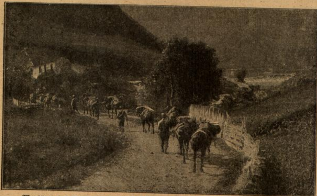
Munition und Verpflegung wird auf Packeseln an die österreichische Front gebracht.

Da wandte er sich an einen der Umstehenden, einen