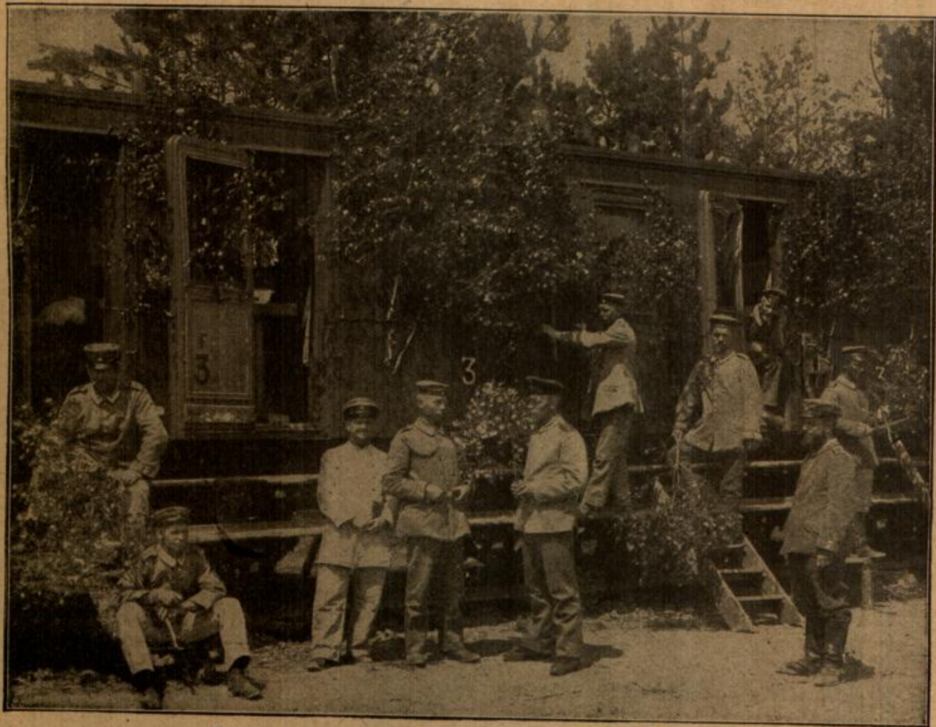
Die Sommerwohnung einer Eisenbahnbaukompanie im Westen. Man hat einen französischen Personenwagen zum Schlafquartier eingerichtet und dem kahlen Äußeren dieser Wohnung durch abgeschlagene Birken usw. ein freundliches Aussehen verschafft.