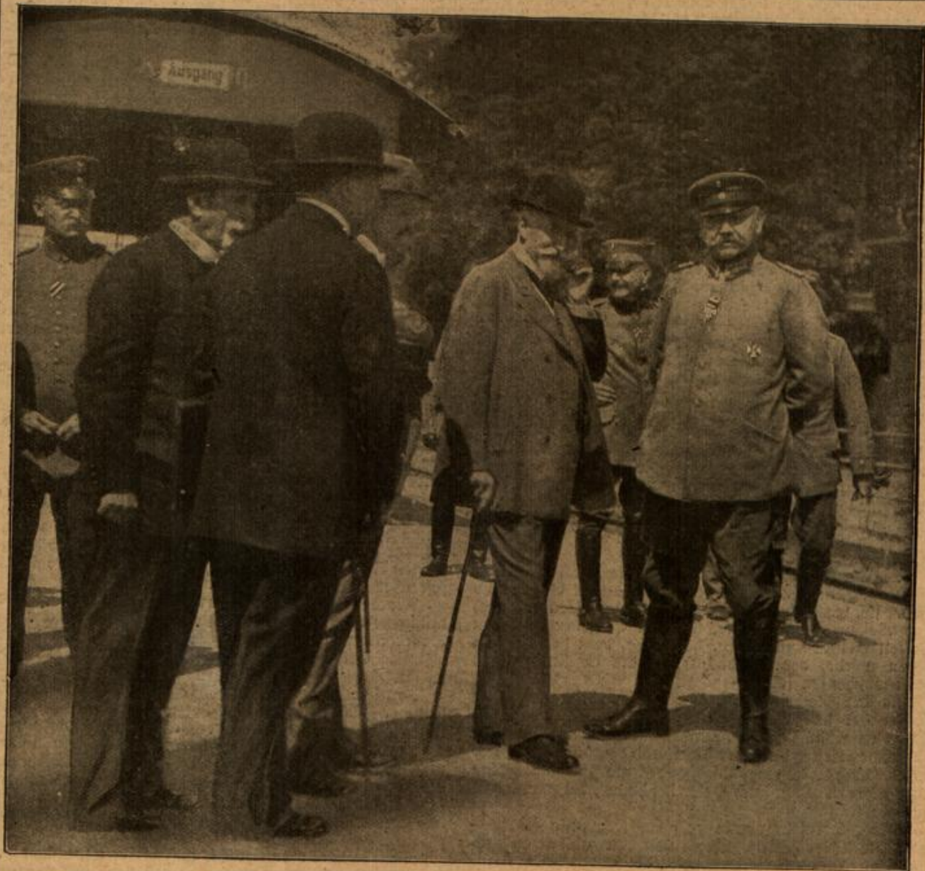
Ein Marschall des Krieges und ein Marschall des Friedens.

Zwei Marschälle, den Generalfeldmarschall v. Hindenburg und den Generalfeldmarschall der Eisenbahnen, denn so kann man den preussischen Eisenbahnminister v. Breitenbach wohl mit Recht bezeichnen, zeigt unser Bild, das bei einem Besuche des Eisenbahnministers im Hauptquartier Ost aufgenommen ist und in eindringlicher Weise eine Charakterisierung der beiden mächtvollen Persönlichkeiten gibt.