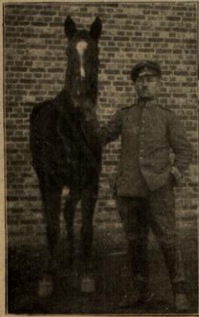
Zwei treue Kameraden.

Wer durch unbekanntes Gebiet geht, durch einen Wald, den er nicht kennt, und in dem er nicht weiß, in welcher Himmelsgegend sich Norden oder Süden befindet, was bei dunklem Wetter festzustellen noch schwer ist, der darf nur auf einige Zeichen achten, um sich unterrichten zu können. Die Stämme der Bäume sind untrügliche Wegweiser. An der Südseite ist die Rinde der Bäume stets trocken und hart, an der Nordseite dunkler, größer, schimmlicht, moosig und geborstener. Das Harz, das bei den Kiefern, Lärchen, Tannen und Fichten herausquillt, ist an der Südseite hart und von bernsteingelber Farbe, auf der Nordseite dunkelgrau und meistens mit einer Staubschicht bedeckt. Eichen, Eschen, Kiefern, Buchen tragen an der Nordseite. Die Blätter sind in dieser Richtung länger und dunkler, als auf der Südseite und auch von weniger Adern durchzogen. Auch die Spinnen sind gute Wegweiser; sie weben ihre Netze immer auf der Südseite der Bäume. Festliegende größere Steine geben ebenfalls die Himmelsrichtung an, auf der Nordseite sind sie meistens bemooft, auf der Südseite kahl. Hat sich jemand im Walde verirrt, so macht er am besten eine kleine Vertiefung in die Erde und hält das Ohr darauf; er hört dann, wenn Leute in nicht zu weiter Entfernung sind, Fahren, Reiten und andere Hantierungen, auf die er zugucken kann. R. S.