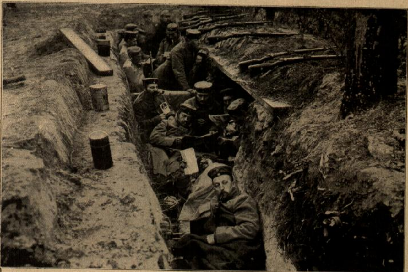
Eine bequeme Ruhepause in den deutschen Schützengräben.