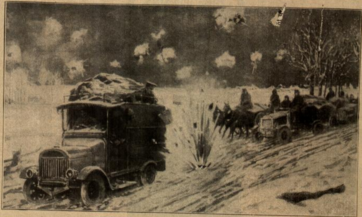
Feindliche Transport-Kolonne im Schrapnellfeuer.

... die zu ... ebnte. ... Neut ... Die f ... Rom ... en K ... ren ... im ar ... Par ... die der ... und d ... te Bege ... ins D ... torben ... mi ... An ... ar ... ge G ... un ... ers ... in d ... Erba ... ator ... Verja ... bis se ... iter ... immer ... g nie ... (C ... en h ... u an ... Hils ... ar fre ... ngen Sto ... muß jedoo ... was von ... mögen zu ... nicht imsic ... wie sie h ... mit Sicher ... Befährlich ... erminder ... einlich la ... as Trink ... eilserregg ... urchfliege ... wegen for ... erföhren