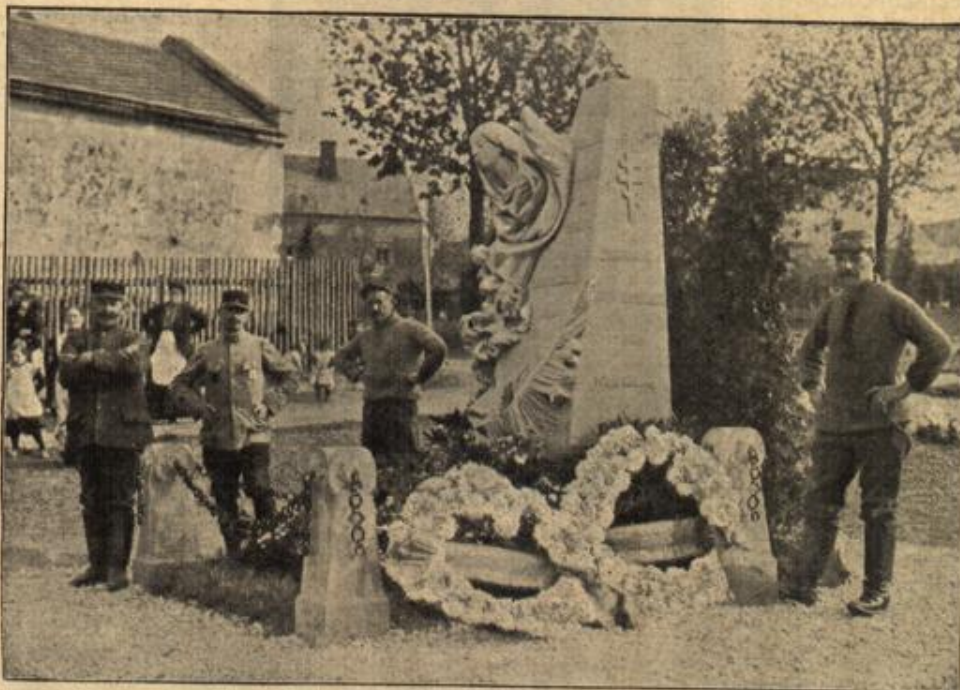
Ein Denkmal für kriegsgefangene Russen und Franzosen in Deutschland. (Mit Text.)