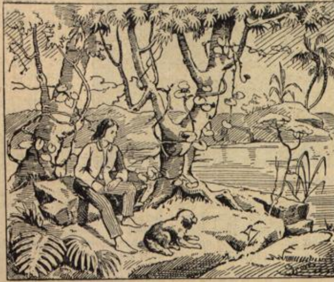
Wo ist die Schwester?

Oberleutnant Albin Mlatzer , der mit einem Unteroffizier und sieben Mann des 1. und 1. Infanterieregiments Nr. 50 während des österreichischen Artilleriefeuers in das italienische Panzerwerk Barcarola eindrang, das unversehrte Fort mit seinen schweren Geschützen und sämtlichen Vorräten besetzte und die italienische Besatzung gefangen nahm. Der tapfere Offizier stammt aus Planina in Krain; er erhielt das Ritterkreuz des Leopold-Ordens, eine der höchsten österreichischen Auszeichnungen.