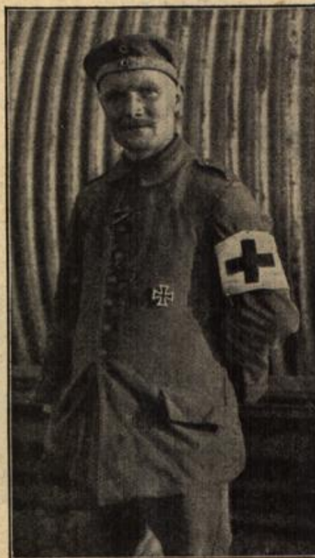
Mit dem Eisernen Kreuz I. Klasse ausgezeichnet neter Arantenträger. (Mit Text.)

„Ich hatte dem Alten die Erlaubnis gegeben, seiner Frau die abgefallenen Pflaumen zu bringen, also lassen Sie ihn nur ruhig gewähren“, sagte sie zunächst zu Daniel, dann aber wandte sie sich an Brand und blühte ihn strafend an.