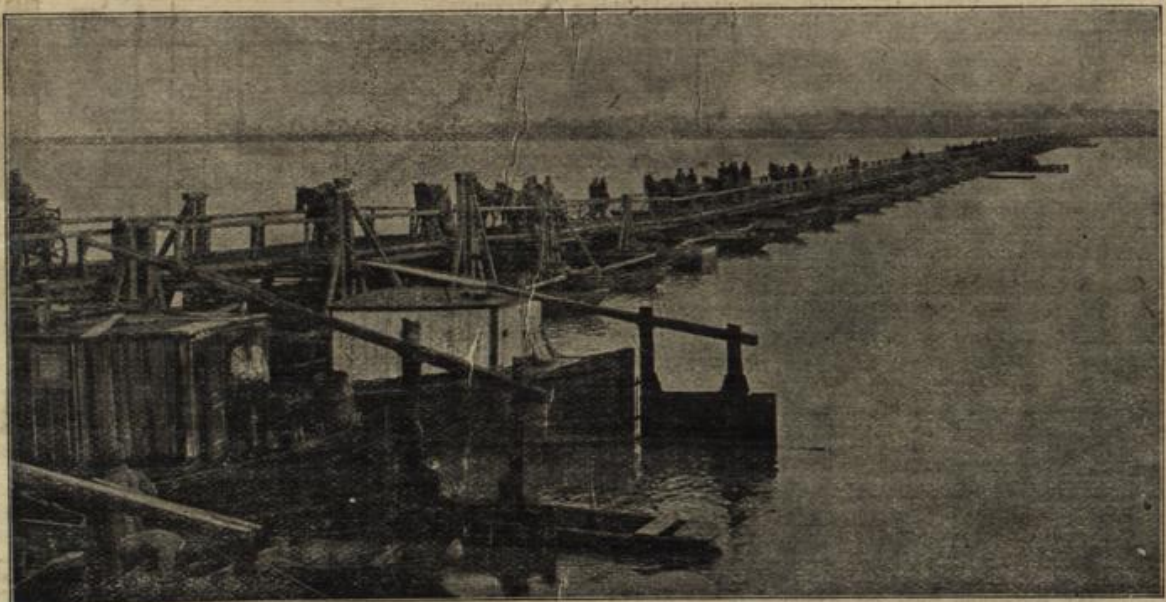
Der Übergang über die Donau. (Mit Text.)

„Liebster, bester Herr Doktor — ich bitte Sie in- dringlichst, sowohl bei der Hermstein wie bei der Lilienborn vorsichtig zu sein! Sie simulieren Ihnen ir- gendwelches Leiden und be- weiden weiter nichts, als Sie auszuhorchen und sich dann über mich in unseren