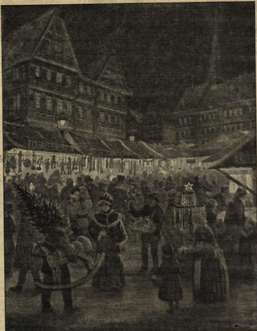
Auf dem Weihnachtsmarkt. Von S. C. Günther.

Als der Doktor aber um die Mittagshunde nach Hause kam es war am Tage vor Weihnachten — wurde ihm eine unverhoffte Freude zuteil. Ein reichgallionierter Diener erschien und brachte ihm ein Billett einer Freifrau von Hermstein, in welcher