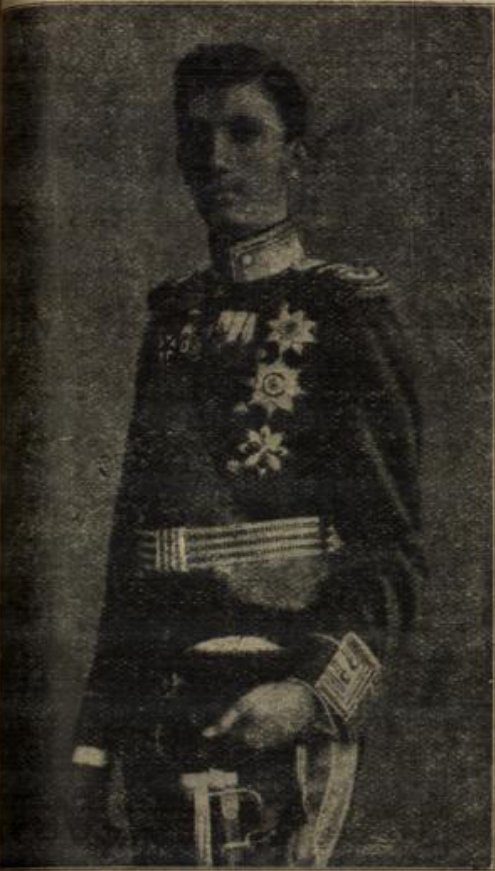
Boris, Kronprinz von Bulgarien.

„Bin ganz damit einverstanden, Herr Doktor — vollständig einverstanden!“ versetzte die Baronin mit süßsaurem Lächeln. „Mit der Angabe der wirklichen Tatsachen wird allen vagen