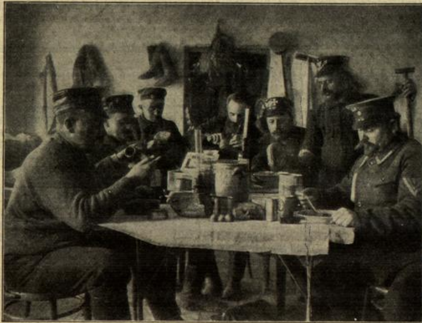
Vom östlichen Kriegsschauplatz: Deutsche Landsturmmänner in ihrem Quartier an der russisch-polnischen Grenze beim Mittagmahl.

Im Osten. Entlang der ganzen Front ist die Lage unverändert. Von der Türkei. Die Kämpfe an der kaukasischen Front haben seit drei, vier Tagen an. In der Nähe der Grenze enden sie in der Umgebung von Milos zugunsten der Türken. Der Feind wurde