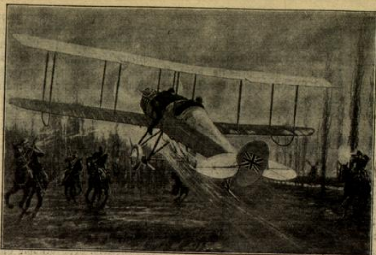
Vom westlichen Kriegsschauplatz: Eine deutsche Kavallerie-Patrouille verhindert den Aufstieg eines englischen Fliegers.