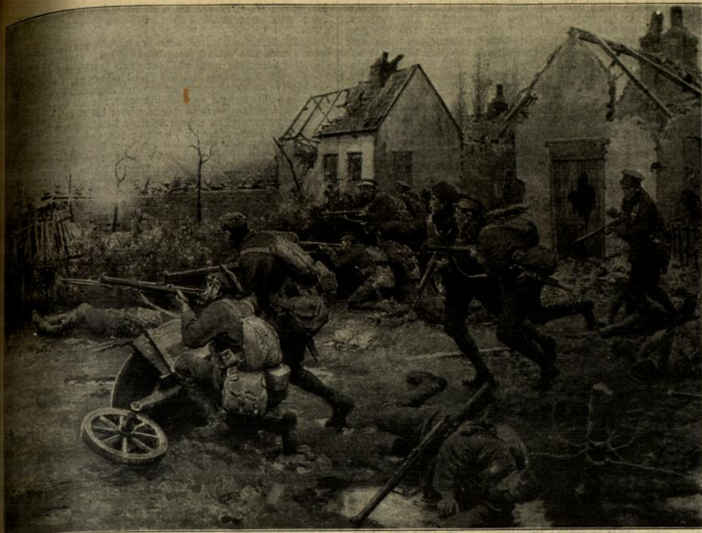
Vom westlichen Kriegsschauplatz: Angriff der Deutschen auf ein von den Engländern besetztes Dorf in Flandern.