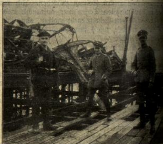
Vom westlichen Kriegsschauplatz: Der zerstörte Schiffsanlegeplatz in Blankenberg.