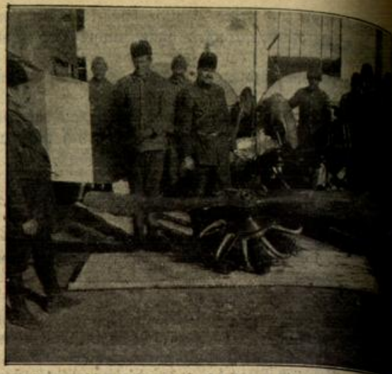
Vom türkischen Kriegsschauplatz: Ein von den Türken heruntergeschossenes französisches Flugzeug.