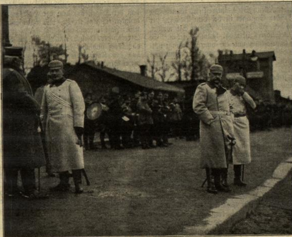
Vom östlichen Kriegsschauplatz:

hin so auffallend gegen dich geworden bin, aber du weißt ja, daß ich's gar nicht so meine, und daß mir nur mitunter die Nerven durchgehen! Also —“