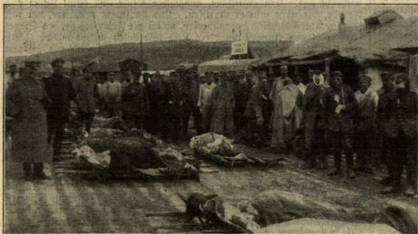
Vom westlichen Kriegsschauplatz: Verladen von Verwundeten nach den großen Gefechten in der Woewre-Ebene.