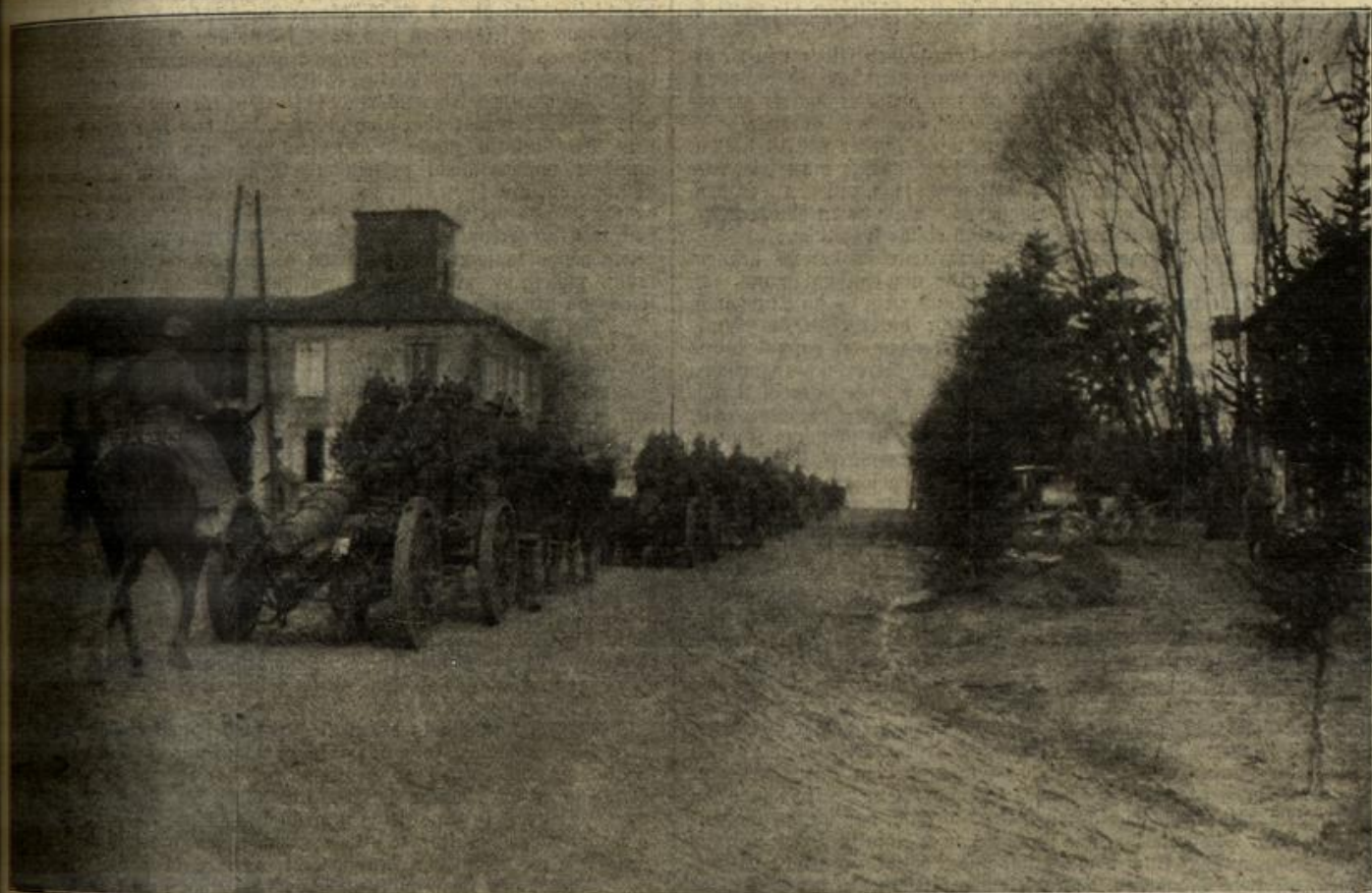
Vom westlichen Kriegsschauplatz: Rückkehr einer schweren Haubitzenbatterie aus der Schlacht zwischen Maas und Mosel.