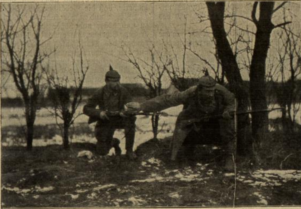
Vom östlichen Kriegsschauplatz: Eine Unteroffiziers-Patrouille stößt auf feindliche Abteilungen.

Tatsächlich waren auf der großen Terrasse bereits einige Damen und Herren anwesend, welche Angelika von der Dame