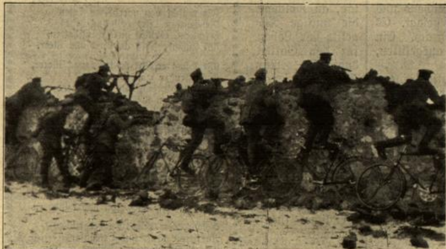
Vom östlichen Kriegsschauplatz: Zusammenstoß einer Radfahrer-Patrouille mit feindlichen Abteilungen.