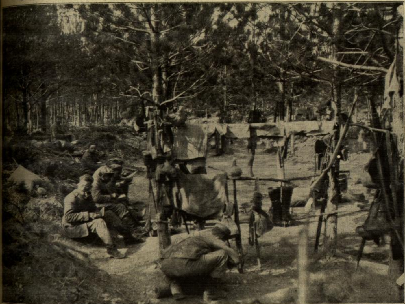
Vom westlichen Kriegsschauplatz: Frühling im Argonner Walde.