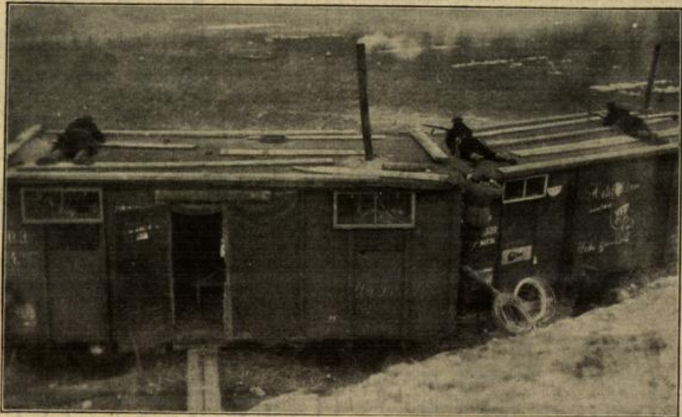
Vom östlichen Kriegsschauplatz: Eine in einem Eisenbahnwagen untergebrachte Feldwache weist den Angriff einer russischen Patrouille zurück.

Im Osten. Russische Angriffe östlich und südöstlich von Augustowo werden abgeschlagen. Zwischen Praszynsz und Jednorozel mehrere russische Angriffe, die sämtlich dem deutschen Widerstande zusammenbrechen. Die russischen Kräfte im Dnabawoelgy werden bei Borzstale vorzeitig abgewiesen.