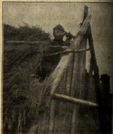
Ein Beobachtungsposten auf dem Schindeldache eines Hauses.