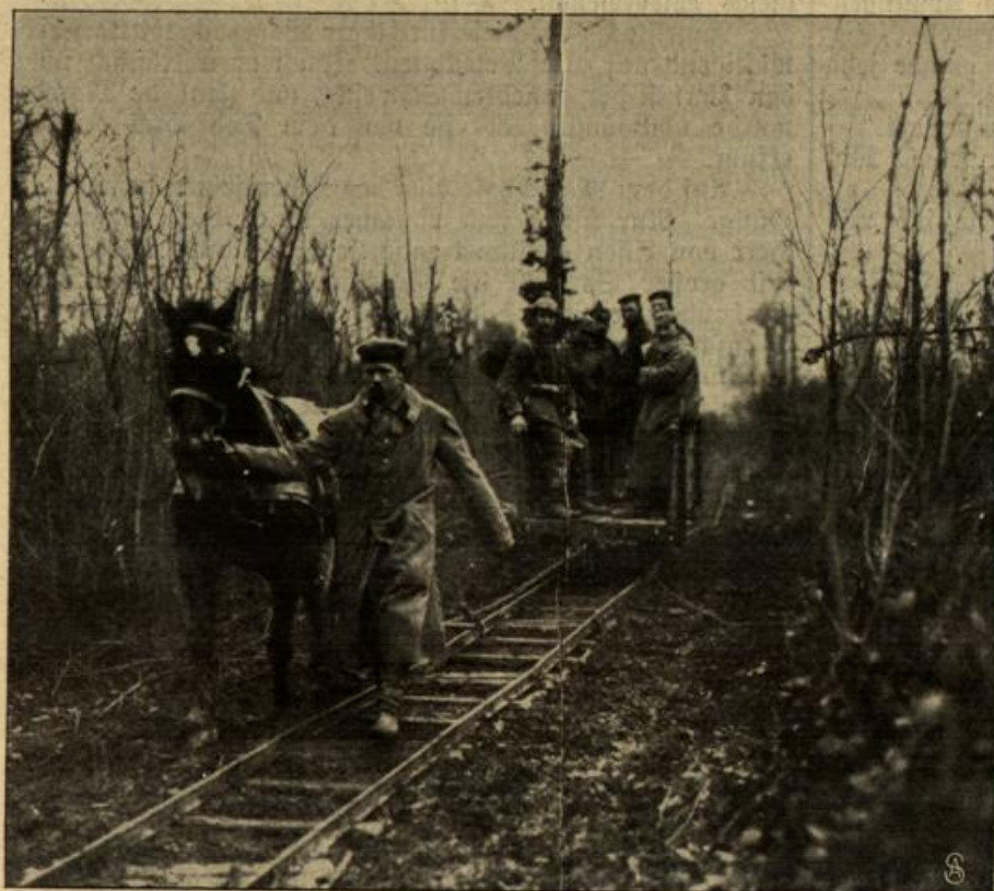
Aus dem Argonner Walde: Transport von Leichtverwundeten zum Verbandplatz auf einer Feldbahn.