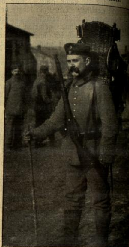
Versorgung der Kameraden im Schützengraben mit Lebensmitteln.