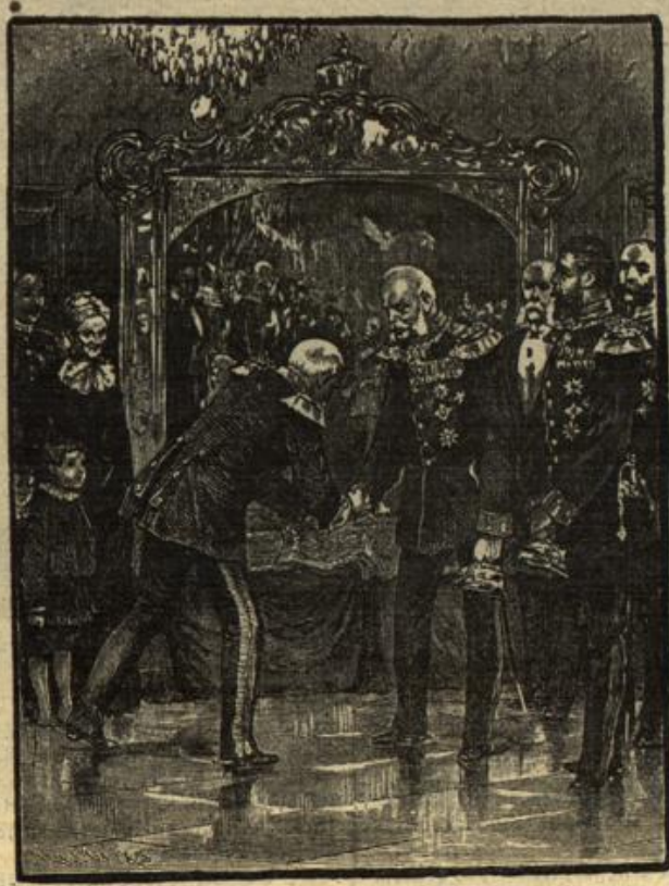
Bismarcks 70. Geburtstag: Beglückwünschung des Fürsten durch Kaiser Wilhelm I. Nach dem Gemälde von A. v. Werner.