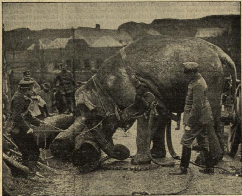
Der Elefant als Kriegshelfer: Indischer Arbeitselefant, der von Hagenbed ...dem Etappen-Kommandanten von Valenciennes zur Verfügung gestellt wurde.

Im Osten. Westlich und südlich von Augustowo scheitern russische ...Angriffe mit schweren Verlusten für den Feind. Nordöstlich von Lomza ...läßt der Feind nach einem mißlungenen Angriff 800 Gefangene in deut- ...schen Händen. Nordwestlich von Ostrolenta entwickelt sich ein Kampf, ...der noch nicht zum Abschluß gekommen ist. In den für die Deutschen günstig ...verlaufenen Gefechten nordwestlich und westlich von Prasznyz werden ...3000 Gefangene gemacht. Russische Angriffe nördlich von Kawa und ...nordwestlich von Nowe Miaslo haben keinen Erfolg. 1750 Russen ...werden hier gefangen. — Südlich Lupuszno werden Angriffe der Russen ...mühe los abgewiesen. Der in dem Raume von Gorlice durchgeführte ...Vorstoß bringt noch weitere Gefangene ein. Die gewonnenen Stellungen ...werden trotz mehrfacher Versuche des Feindes, sie wieder zurückzuerobern, ...überall behauptet. — Ununterbrochen wiederholen sich an der Karpathen- ...front feindliche Angriffe, die je nach der Entwicklungsmöglichkeit bald mit ...starken, bald mit untergeordneten Kräften durchgeführt werden. So ...werden wieder an mehreren Stellen heftige Angriffe der Russen, die bis