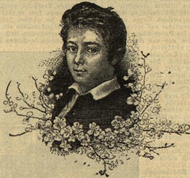
Bismarck im 11. Lebensjahre.