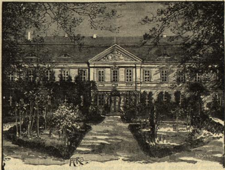
Bismarcks Stammschloß in Schönhausen.