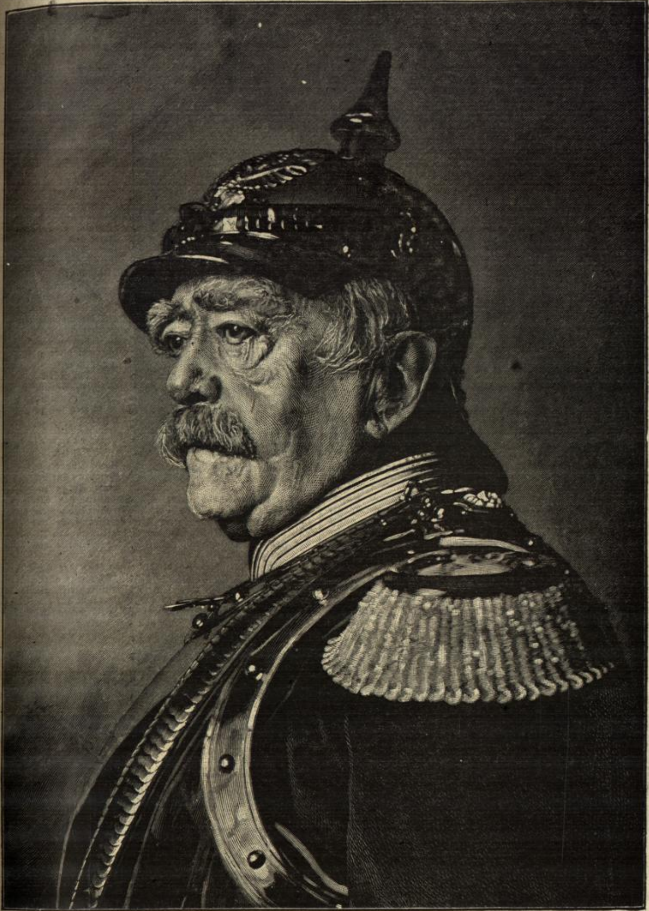
Fürst Otto von Bismarck, der erste Kanzler des Deutschen Reiches.