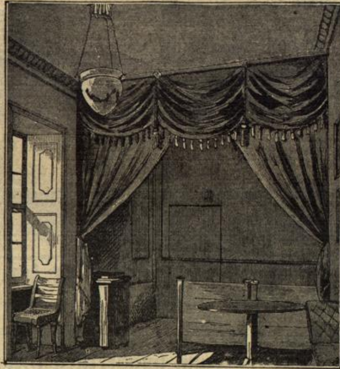
Das Geburtszimmer Bismarcks in Schönhausen.

Nach dem Tode Kaiser Wilhelm I. verließ Bismarck auch unter dessen Nachfolger im Amt; Wilhelm II. hat er ebenfalls noch mehrere Jahre als treuer Ratgeber zur Seite gestanden. Leider kam es Anfang 1890 über Fragen der inneren Politik zu Differenzen zwischen Kaiser und Kanzler, die letzteren zwangen, sein Entlassungs-