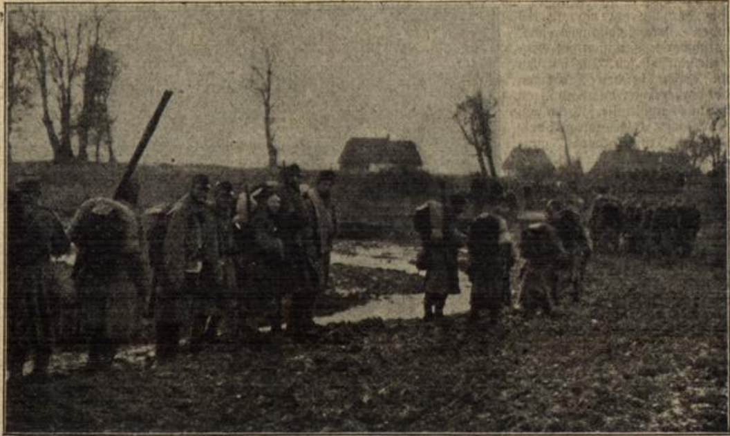
Vom östlichen Kriegsschauplatz: Oesterreichische Infanterie auf dem Vormarsch in Russisch-Polen.

Von der Türkei. Die englischen Schiffe ...„Rajah“ und „Arcton“ verstärken die feind- ...liche Flotte, aber durch das Feuer der türkischen ...Batterien werden ein französischer Panzerkreuzer ...neger Gefecht gesetzt und ein englischer Panzer- ...kreuzer beschädigt. Infolge des türkischen Feuer- ...schusses ziehen sich die feindlichen Schiffe zurück und ...hellen die Beschießung ein.