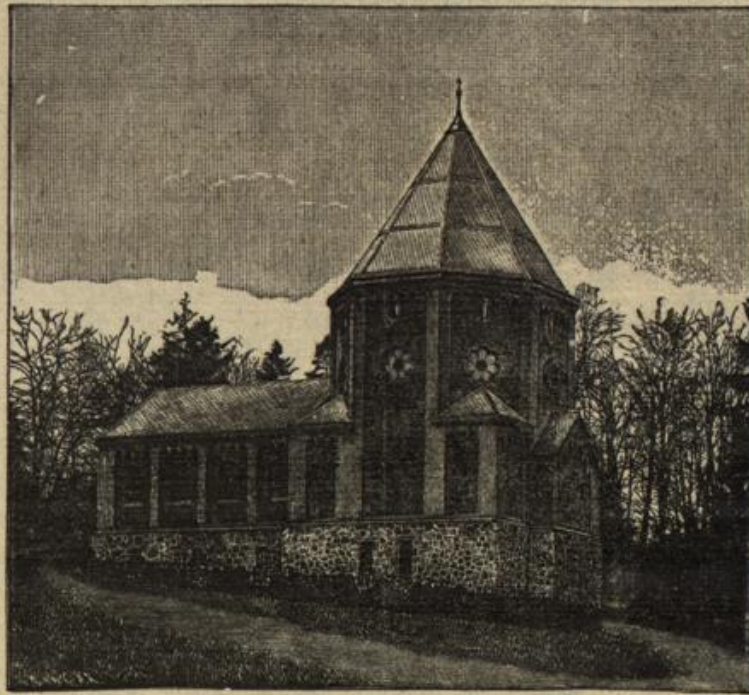
Das Mausoleum in Friedrichsruh, Bismarcks letzte Ruhestätte.

Wenn die französischen Vorposten weiter vorgehen, greifen Sie dieselben an.“