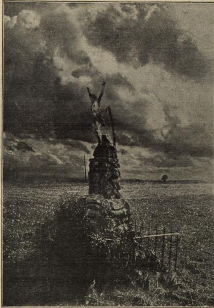
Zerschossenes Feldkreuz in der Nähe des Schlachtfeldes bei Saarburg auf der Straße von Saarburg nach Bruderdorf.

10. März: Im Westen. Die Gefechtsstätigkeit wird durch Schnee und starken Frost eingeschränkt, in den Vogesen sogar fast gehindert. Nur in der Champagne wird weitergekämpft. Bei Souain bleiben bayrische Truppen nach lang andauerndem Kampfgemenge siegreich. Nordöstlich de Mesnils dringt der Feind an einzelnen Stellen vorübergehend in die deutschen Linien ein. In erbittertem Nahkampf, bei dem zur Unterstützung herbeieilende französische Reserven durch den deutschen Gegenstoß am Eingaben verhindert werden, werfen die Deutschen den Feind endgültig aus der deutschen Stellung. Die Einbuße des Feindes ist auf mindestens 45 000 Mann zu schätzen. Damit ist der mit großen Mitteln angelegte Durchbruchversuch der Franzosen in der Champagne