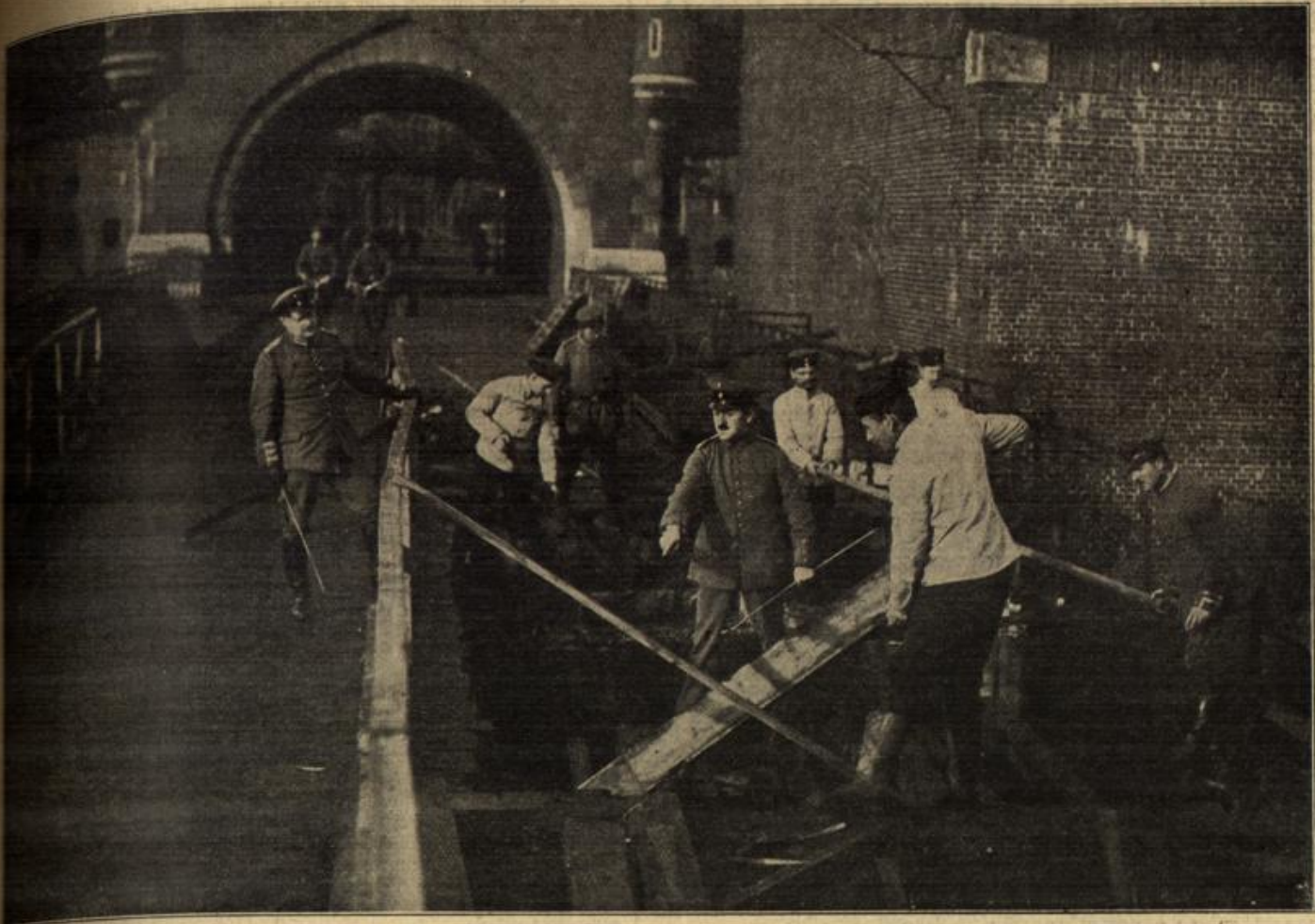
Vom westlichen Kriegsschauplatz: Eine von Granaten zerstörte Brücke von Antwerpen wird durch deutsche Pioniere wieder hergestellt.