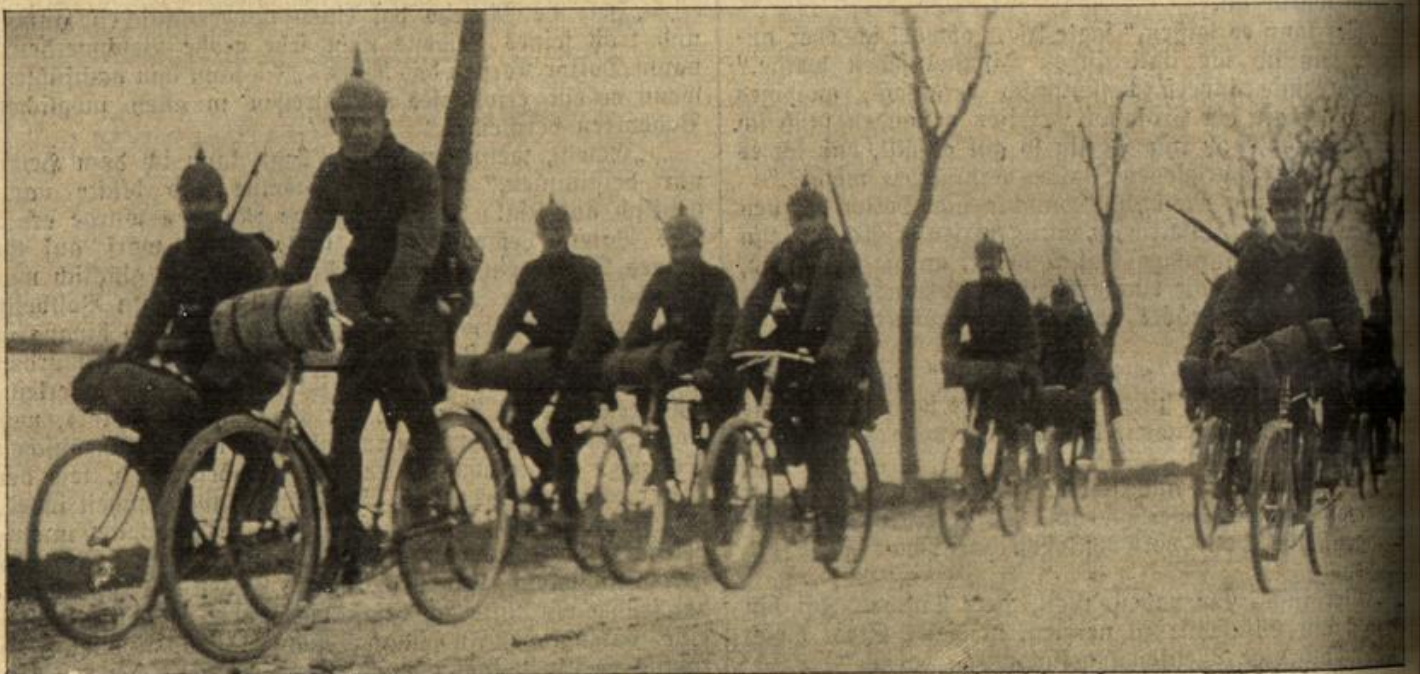
Vom östlichen Kriegsschauplatz: Deutsche Radfahrer-Kompagnie auf einer Erkundungsfahrt.