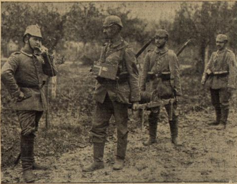
Vom westlichen Kriegsschauplatz: Tragbares Feldtelefon, das eine Fernsprechverbindung bis in die vordersten Schützengräben ermöglicht.