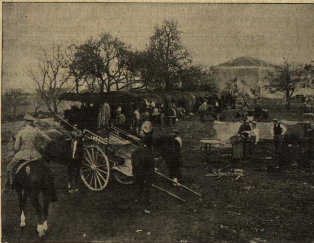
Vom westlichen Kriegsschauplatz: Ein Feldlager mit Feldschmiede in der Gegend von St. Mihiel.

ser Herr, der ist nicht so, das ist ganz ausgeschlossen. Du liebe Zeit, er kann seine Töchter doch nicht allein zu Hause lassen. Wir haben es ja.“