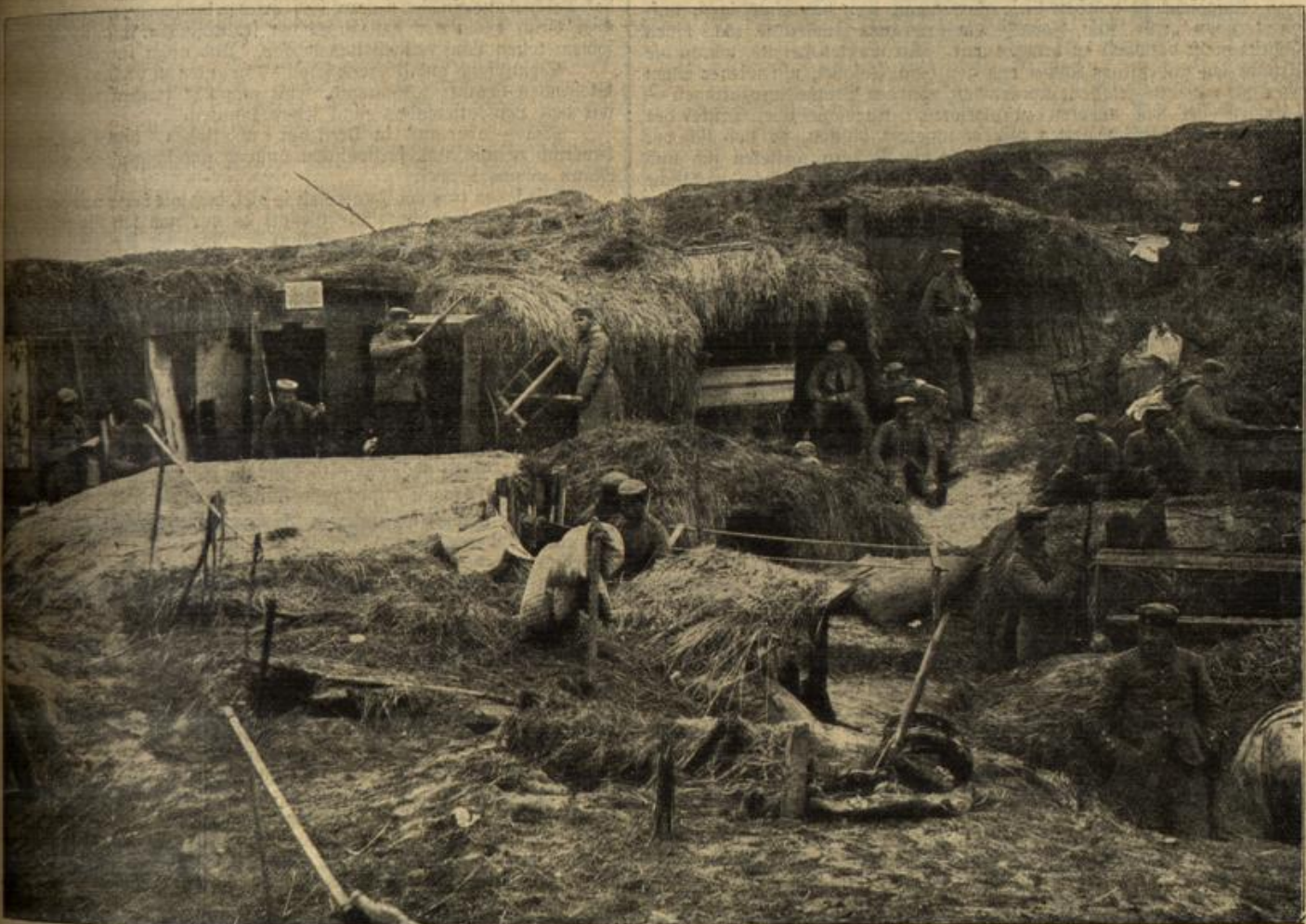
Vom östlichen Kriegsschauplatz: Erdwerte und Wohnhöhlen unserer Soldaten in Rußland.