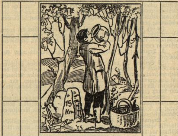
Wer belauscht den nachhaften Peter?