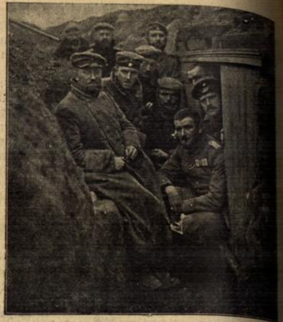
Ein Stabsquartier im vordersten Schützengraben, 80 Meter vor dem Feind.