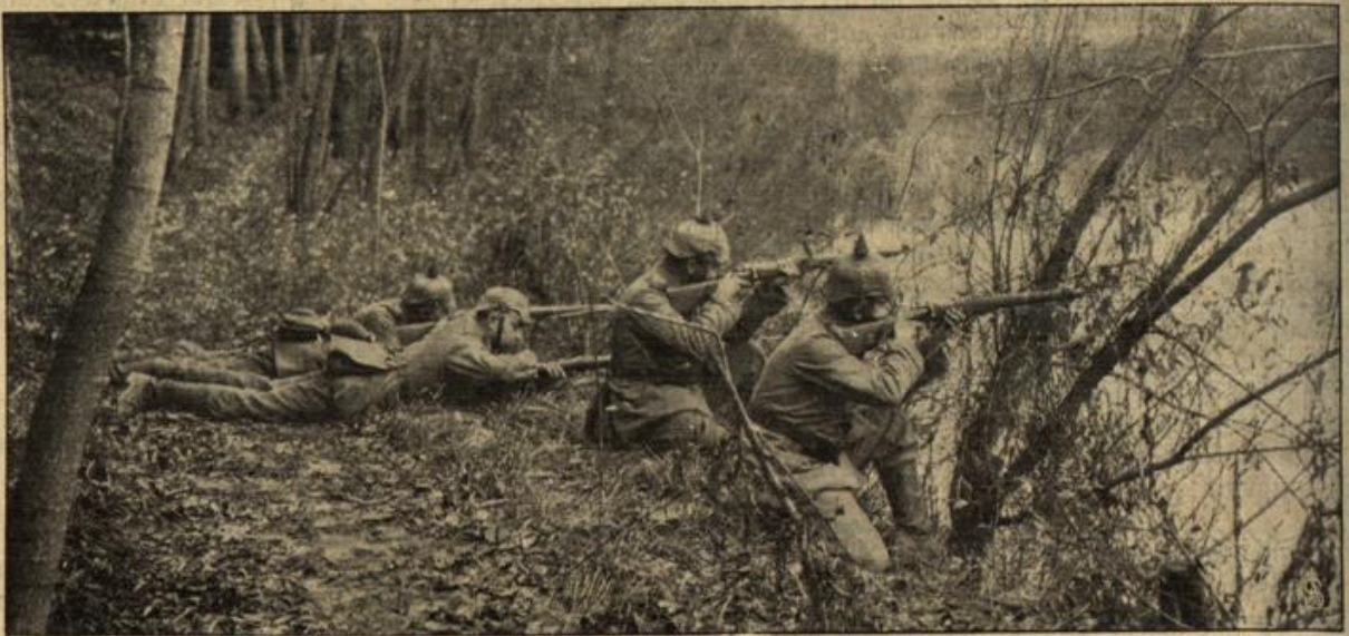
Vom westlichen Kriegsschauplatz: Deutsche Patrouille am Ufer der Aisne.