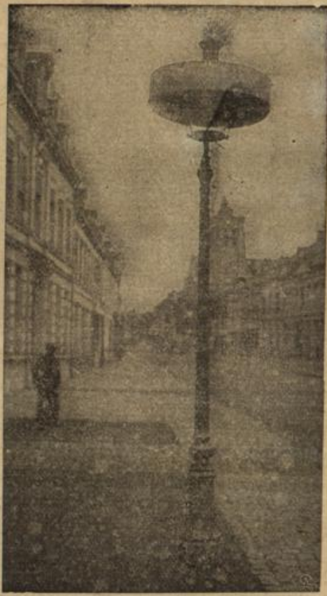
Begen Fliegerangriff abgeblendete Straßenlaterne im besetzten Frankreich.

Vieles wußte man ja schon. Daß Hagen vor Jahren seine gutbezahlte Stellung im Kontor eines angesehenen Fabrikbetriebes aufgegeben, da ihm eins seiner größeren Anfangswerke, ein poetisch verfaßter, bunt-