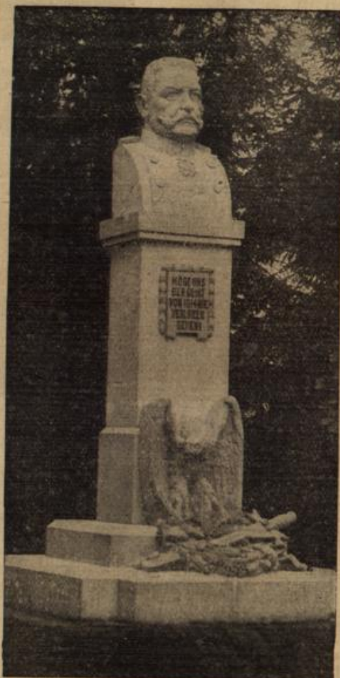
Enthüllung des Hindenburg-Denkmales in Stallupönen.

„Haben Sie mich? Haben Sie süße Sahne?“ rief er dem schiefgewachsenen Be- sizer zu.