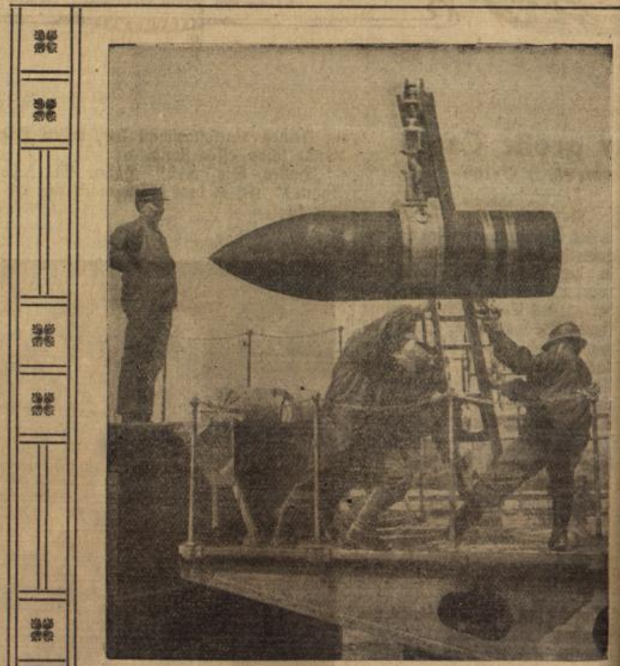
Ein Geschöß der neuen französischen 40 cm-Geschütze.

Es pochte an der Eingangstür erschien. Er brachte schon wieder Ge sie m zwei Pfund von der besten Die in Speiseschokolade und zwei Bücher den G