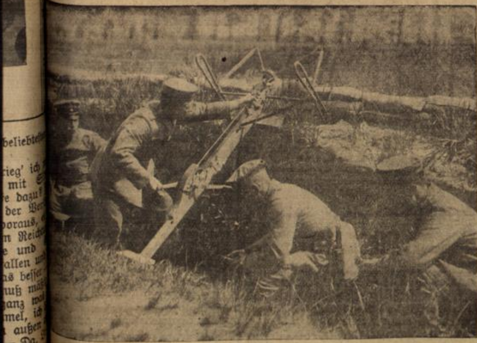
Wie eroberte französische Schlendermaschine bei der Wiederverwendung durch unsere Feldgranen.

„Gott, wie sie gleich glüht.“ Die Tante strich ihr beschwichtigend über den schlanken Arm. „Mal kommt's ihm schon, Lie — 'mal kommt's ihm sicherlich. Du mußt dich nicht so sehr zerquälen darum, wo du ohnehin deine andere Herzensnot hast. Deins