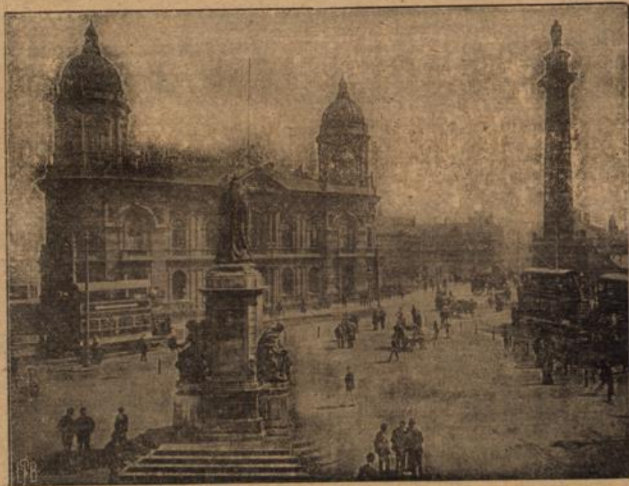
Der Victoria-Platz in Hull in England, der Schauplatz wiederholter Zeppelinangriffe.

Eines Tages — es war im Mai des Jahres 1914 — wandelte unser Freund wieder in die blühende Natur hinein. Welches Zeichens er war, das sah man ihm schon von weitem an. Außer dem Ranzen trug er sein Malgerät und einen riesigen Schirm gegen Sonne, Wind und Wetter. Früh mit dem Tag war er auf, sang mit