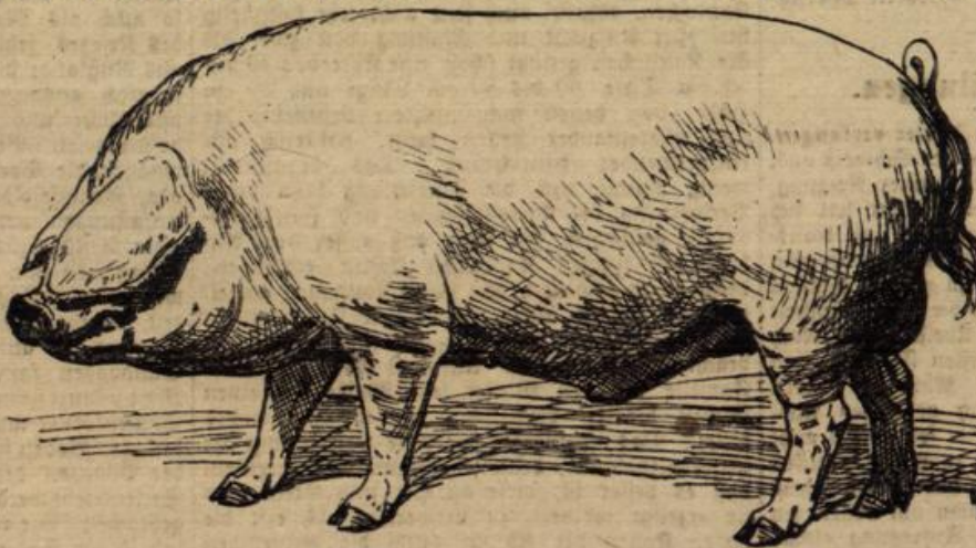
Veredeltes Mastschwein. (Eber.)

tragende Sauen und die Ferkelsauen bleiben jedoch zu Hause. Mit dem Aus- trieb kann man jederzeit von Mitte April an beginnen. In der ersten Zeit tritt infolge des ungewohnten Herumlaufens eine Abnahme des Körpergewichtes ein, dem jedoch bald eine Zunahme folgt. Die Menge des täglich zu reichenden Zufutters hängt von der Beschaffenheit der Waldweide ab. Wald und Wald ist in dieser Beziehung ein großer Unterschied. Am magersten ist die Kost in reinen Nadelholz- wäldern, am besten in gemischten Beständen