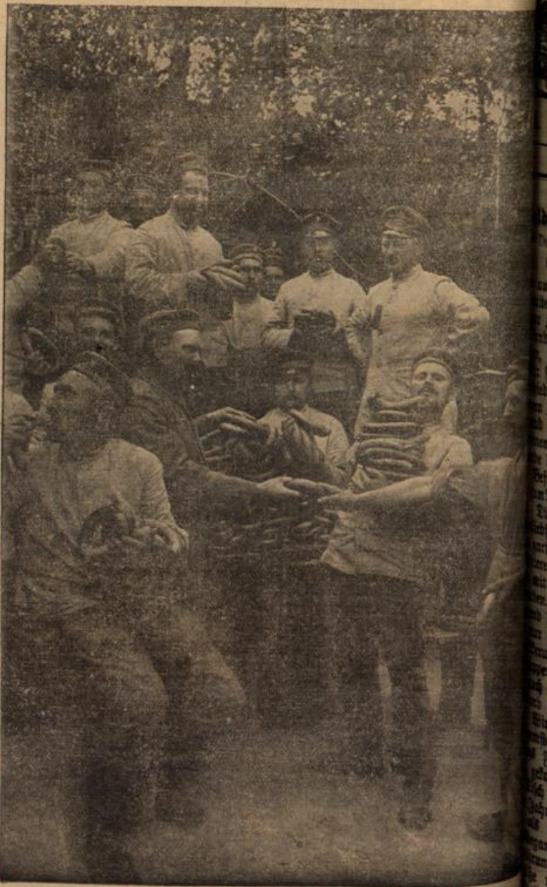
Ein seltener Bekehrtesen.

„Ich habe immer an dich gedacht; seit Neujahr, seitdem du Lied in der Kirche sangst, kam dein Bild nicht mehr aus dem Sinn. Sage, schilfst auch du, daß ich dich freust du dich?“