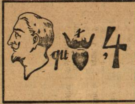
(Auflösung folgt in nächster Nummer.)

gunnung und Vermischung solcher einzelner „oberer Winde“ eigentümliche Störungen. Letztere sind ohne Zweifel auch der Grund dafür, daß die Fortpflanzung des Schalls auf und über der Erde mit einer merkwürdigen Ungefehmäßigkeit vor-