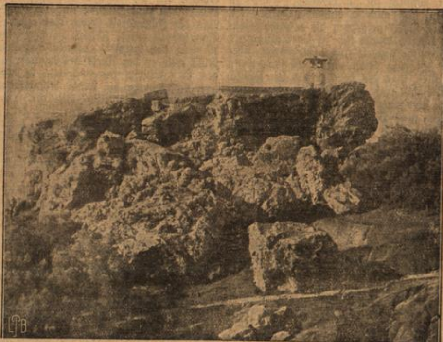
Die Burg von Rouja.

„Er wußte keine Antwort. Ihm war dies alles so fremd, so eigentümlich —“