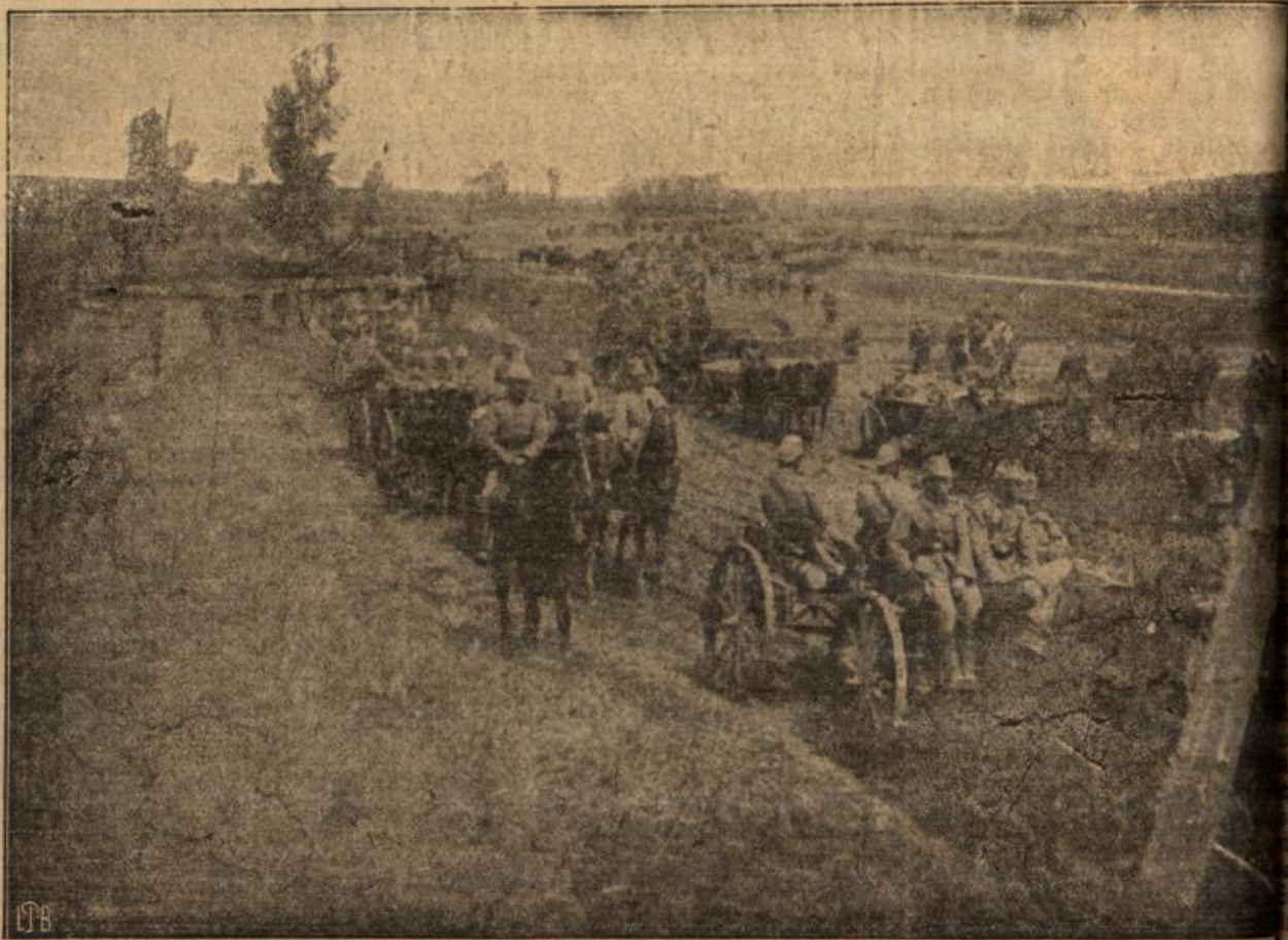
Deutsche Armeedivision beim Vorrücken in die Stellungen hinter Pöchl.

Und er stammelte immer wieder, daß er das Bein sehen müsse fehlende Bein —