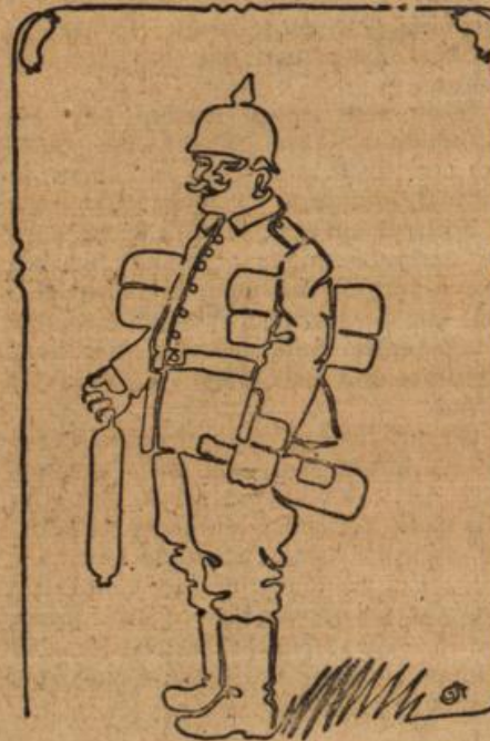
Zeichnung in einem Zuge.

gunnung und Vermischung solcher einzelner „oberer Winde“ eigentümliche Störungen. Letztere sind ohne Zweifel auch der Grund dafür, daß die Fortpflanzung des Schalls auf und über der Erde mit einer merkwürdigen Ungefehmäßigkeit vor-