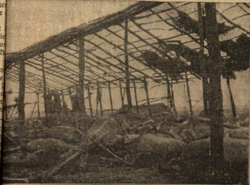
Die Wirkung einer Granate auf einen französischen Pferdeschuppen.

eine deutsche Granate. War man schon überrascht, als die Zerstörungen bekannt wurden, die im mandchurischen Kriege (1905) die japanischen Granaten anrichteten, so ist heute die artilleristische Anschauung selbst von Fachleuten vollständig gewandelt. Die weittragenden englischen Schiffskanonen sind weit überflügelt durch Deutschlands 42 Zentimeter-Geschütze und auch durch Österreichs 32 Zentimeter-Mörser und niemand vermag mit Bestimmtheit zu sagen, ob nicht auch noch während des Krieges neue Geschütze austauschen werden, deren Tragweite und Explosionskraft noch größer sind. — Man sieht ja, daß auch Serbien, dessen artilleristische Bewaffnung nicht auf der Höhe stand, dank seiner Bundesgenossen, über Artillerie schwersten Kalibers verfügt. (Engländer, Franzosen und Russen haben Batterien entsandt, um den Bundesgenossen zu stärken). Unser unteres Bild zeigt englische und serbische Artilleristen, die eines dieser Riesengeschütze in Stellung bringen. Ein französischer Militärkritiker hat vor einiger Zeit aus- gerechnet, daß ein Schuß aus einem der schweren Artilleriegeschütze die Fall- und Durchschlagkraft von 18,000 Zentnern hat.