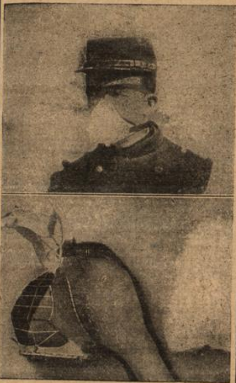
Neuer Respirator zum Schutze gegen giftige Gase im französischen Heere.

Dicht unterhalb des Herzens war die Kugel eingedrungen, hatte aber wunderbarerweise einen Weg genommen, der keinen edlen Teil traf. Wie ein Wunder war es. Das Herz mußte sich grade in dem Augenblick, wo die Kugel eindrang, zusammengezogen haben. Eine Sekunde später wäre es durchbohrt gewesen.