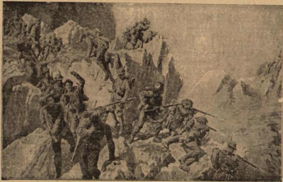
Vom italienischen Kriegsschauplatz: Ein Gefecht in den Alpen.

sch einst der Riesenaufgabe unter- Geschichte des Weltkrieges zu wird vor allem von den mannig- überraschungen berichten müssen, Krieg zweier Mächte gegen ganz mit sich gebracht hat. Vielleicht sehr für die militärischen Ober- als für den Laien, der staunend immer anwachsenden Menge neuer tel hört. Nicht allein, daß der See durch die schneidige Hand- er deutschen Unterseeboote für alle e Überraschung war, auch der Lande hat fast mit jedem Tage ues gebracht. Wer nicht in enger mit militärischen Stellen stand, nicht träumen lassen, daß einmal eile, Handgranaten, Rauchent-