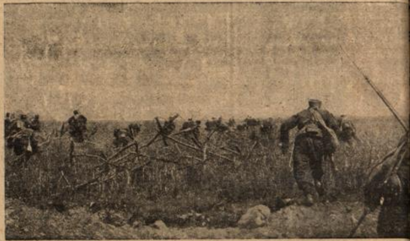
Bajonettangriff eines französischen Zouaven-Regiments.