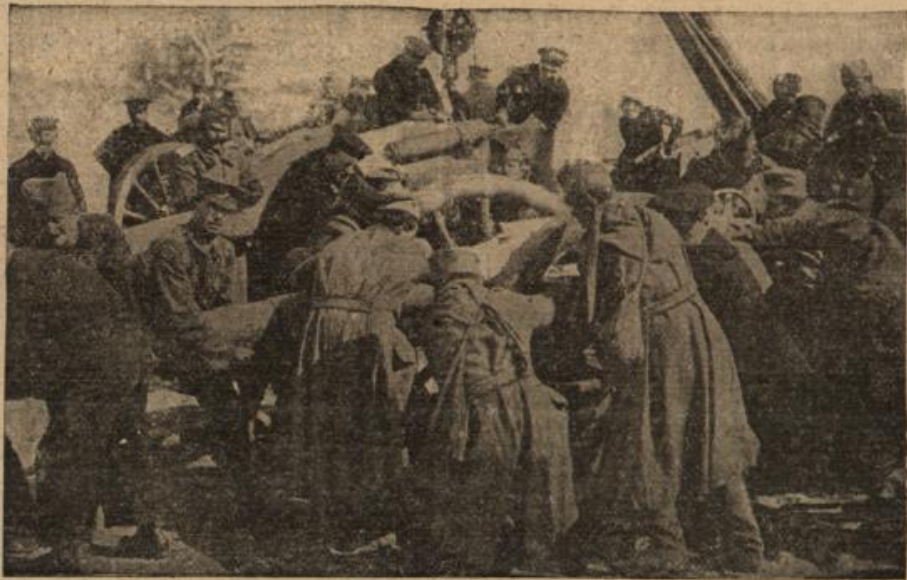
Englische und serbische Artilleristen bringen eine Kanone schweren Kalibers in Stellung.

unterirdische Minen in diesem eine hervorragende Rolle spielen Daneben aber kommt noch die der Kriegsfirmer in Betracht. ersten hatte sich nach dem ersten Vorwärtstürme der deutschen ein hartnäckiger, langwieriger Krieg entwickelt. Nicht mehr in Raume gilt es den Gegner durch und Strategie zu schlagen, sondern um Meter mußte ihm Boden abge- werden. Noch größere Schwierig- keit vielleicht anfangs der Gebirgs- Krieg er in den Vogesen geführt werden Unter ähnlichen Umständen, wie deutschen und Franzosen an den abhängen, müssen Österreicher und sich fast auf der gesamten Front des Kriegsschauplatzes kämpfen. Bild veranschaulicht eine sechsende Gruppe. In schweigender Gletscher- stille lausendfach das Echo jedes Schusses erhört, ringen kleine Abteilungen mit- einander, um Gelände zu gewinnen. — Das mittlere Bild zeigt die Zerstörung eines französischen Pferdeschuppens durch