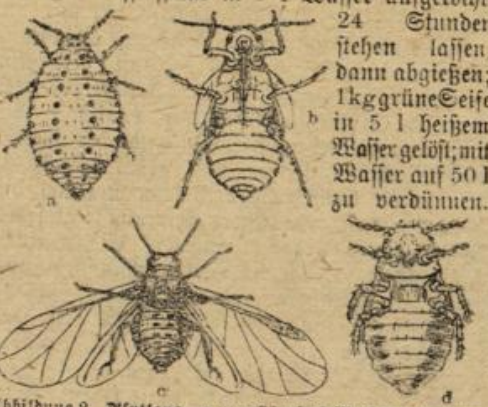
Abbildung 2 Blattläuse. a ungeflügeltes Weibchen (Parve), b Weibchen mit Flügelanlagen (Nymphen), c geflügeltes Weibchen, d ungeflügeltes Männchen (Geschlechtsreifer).

maßen hergestellt: In 10 l warmem Wasser werden 150 g gelbe Transparenzschmierseife aufgelöst und hierauf 20 g bestes (gegen Luft und Licht geschütztes) Schwefelkalkium eingerührt. Als Spritzmittel wird Quassiaabruhe empfohlen. 250 g Quassiaspäne in 5 l Wasser aufgelocht, 24 Stunden stehen lassen, dann abgießen; 1 kg grüne Seife in 5 l heißem Wasser gelöst; mit Wasser auf 50 l zu verdünnen.