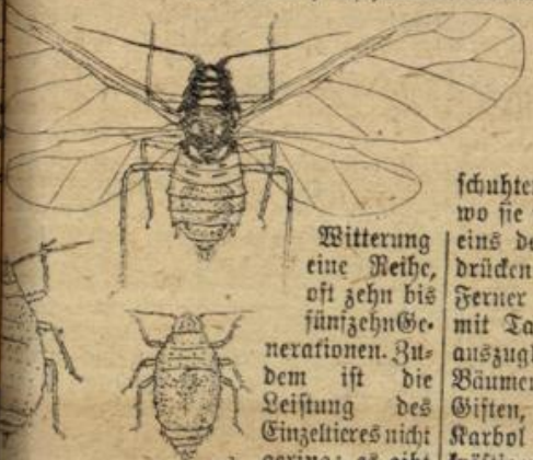
Abbildung 1 Blutlaus. a Weibchen aus b geflügeltes Weibchen, c Weibchen, d weibliches Geschlechtsreifer.

Blutlaus (Schizoneura lanigera), die in Abbildung 2 in verschiedenen Lebensformen dargestellt ist. Ihre Lebensweise ist der der Blutlaus ungemein ähnlich. Die Blutläuse, die man im Sommer vorfindet, sind sogenannte Ammen, d. h. erblich befruchtete Weibchen, die