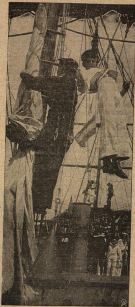
Hängend auf dem Unterhalen.

lassen und Stände sich in immer wachsender Zahl zu diesen Uebungen melden, die nicht nur eine gesunde Körperübung darstellen, sondern auch eine Art Prüfung für kommende Tage, für die Pflichterfüllung während der Dienstzeit bedeuten. Nebenstehend sehen wir das Antreten der in Seemannstracht gekleideten Jungmänner. Uebungen an der Bordkanone und am Kompaß zeigen das untere und obere Bild. Ganz besonders nett muten auch unsere beiden Seitenbilder an, welche uns die praktische Betätigung im Mast- und Takelwerk des Schiffes vorführen. Es ist eine Freude zu sehen, mit welcher Geschicklichkeit und mit welcher edlen Dreifigkeit die jungen Burschen in dem