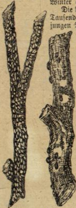
Abbildung 4. Schildläuse.

Herbst treten auch geflügelte Weibchen auf, die vom Winde auf weite Entfernung verschleppt werden, bis sie zur Niederkunft gelangen. Ihnen entspringen 5 bis 10 Junge zweierlei Art, die Geschlechtsstiere beider Gattungen, die größeren, die Weibchen, von gelblicher Farbe, die Männchen kleiner und grünlich gefärbt. Sie haben keine andere Bestimmung als die Fortpflanzung. Nach der Paarung legt jedes Weibchen ein großes, rotgelbes Ei in einen Rindenspalt. Noch im Herbst schlüpft daraus eine Larve, die überwintert und bis zum Frühjahr zur Amme heranwächst. Aber auch viele der ungeschlechtlich erzeugten Ammen bleiben über Winter am Leben.