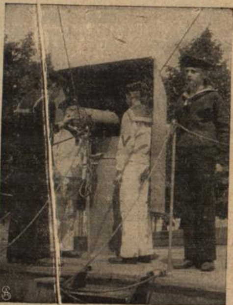
In der Bordkanone.

wird sich den Eindruck nicht verwehren können, daß bei allen Teilnehmern, alten wie jungen, ein guter Geist vorherrschend ist. Und wir sind ja nun belehrt: Der Geist ist in erster Linie ausschlaggebend für den Erfolg. Darum darf uns die Einrichtung des Schulschiffes mit Stolz erfüllen. Auch hier wird lediglich das frohe Spiel zur Arbeit, die den Geist auf das hohe Ziel hin lenkt: Dem Vaterland immerdar starke und schon vorgebildete Verteidiger heranzuschaffen.