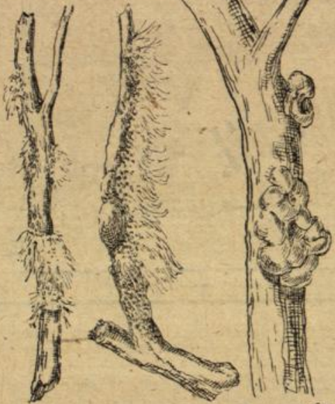
Abbildung 3. Von Blutläusen befallene Zweige und Äste.

mehrere Geschlechter hindurch ohne Begattung etwa 30 bis 40 Junge gebären. Diese sind nach 2 bis 3 Wochen ausgewachsen und ohne weiteres ebenfalls ohne Paarung zeugungsfähig. Soweit sie nicht mehr Platz auf der alten Stelle finden, gründen sie anderswo neue. Die Nachkommenschaft ist daher fast unbegrenzt, die Gefahr der Blutlausherde offenbar. Im