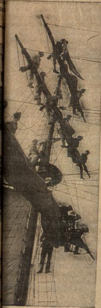
Takelwerk des Schulschiffes.

wird sich den Eindruck nicht verwehren können, daß bei allen Teilnehmern, alten wie jungen, ein guter Geist vorherrschend ist. Und wir sind ja nun belehrt: Der Geist ist in erster Linie ausschlaggebend für den Erfolg. Darum darf uns die Einrichtung des Schulschiffes mit Stolz erfüllen. Auch hier wird lediglich das frohe Spiel zur Arbeit, die den Geist auf das hohe Ziel hin lenkt: Dem Vaterland immerdar starke und schon vorgebildete Verteidiger heranzuschaffen.