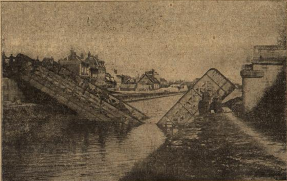
Gesprenzte Brücke in Pont l'Éveque bei Royon.