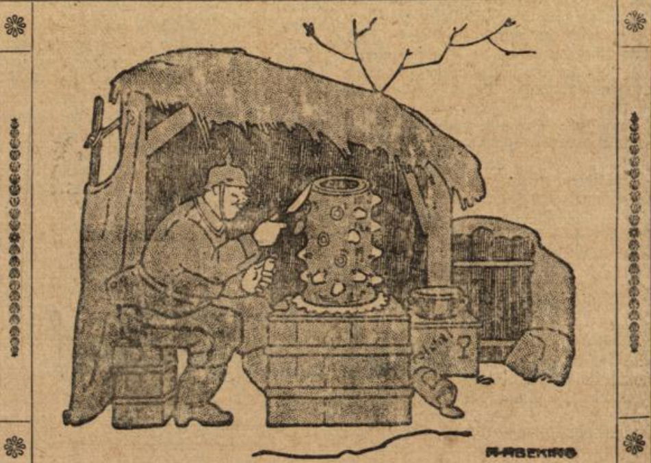
Der Baumkuchen. (Aus einem Hummerbrief.)

— — — Ich schnitt mir mehrere „Nasen“ ab und verzehrte sie mit großer Freude und prachtvollem Appetit. — — —