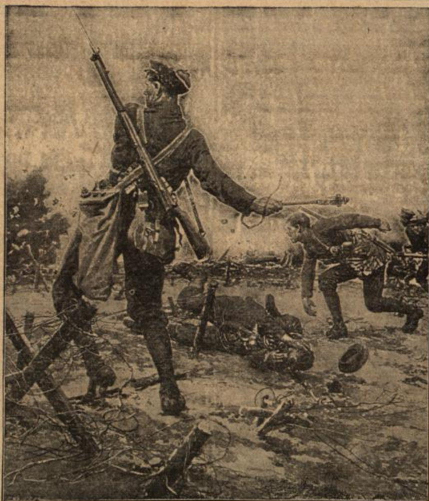
Eine Szene vom westlichen Kriegsschauplatz nach einer englischen Darstellung: Englische Minenwerfer in Tätigkeit.

er, Herr Kaiser, nun hab ich nur Dich, ge, mein deutsches, nun schlägt's nur und darum stark, so hatte er aber ganz frei ist, wird zuerst Freilich hatte es niemand dem