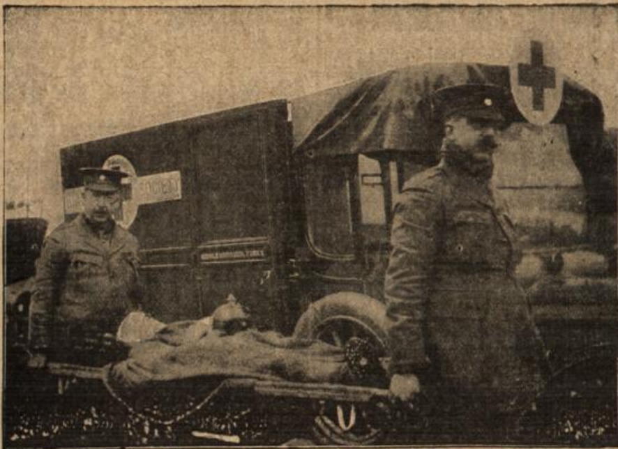
Das englische Rote Kreuz in Flandern.

Transport eines verwundeten deutschen Kriegers, dessen Helm ihm mitgegeben wurde.