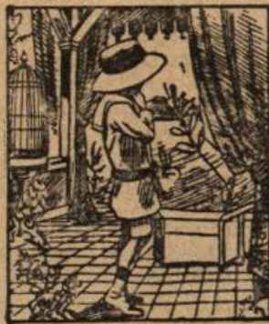
Wo ist der von Hänschen erwartete Papa?