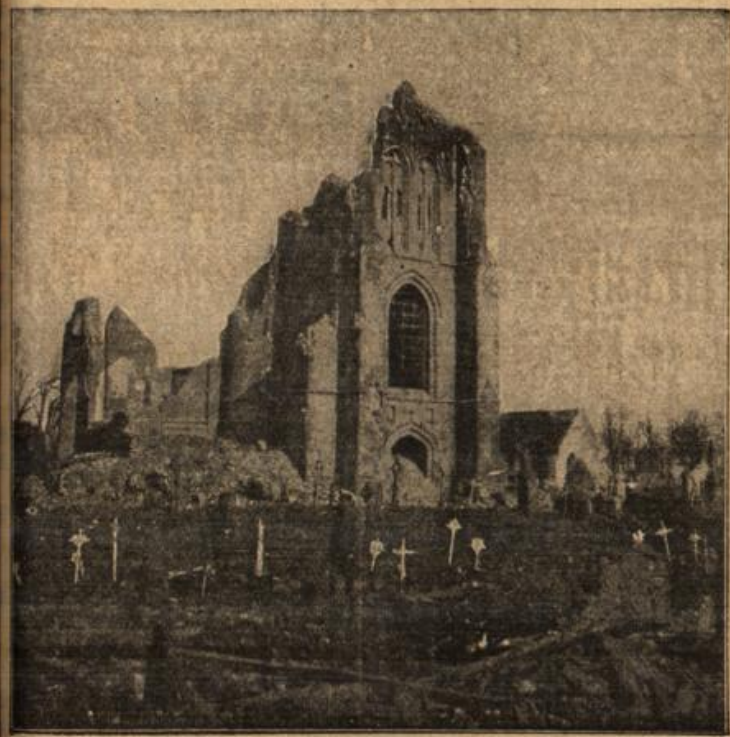
Kriegsverwüstungen in Flandern.

Die Kirche von Langemark nach dem Sturm auf den Ort.