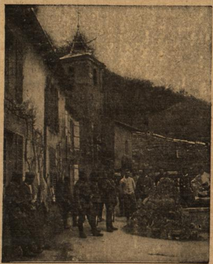
Ein Bismarckdenkmal in Frankreich.