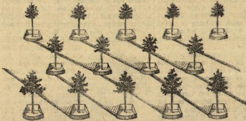
Abbildung 5. Stufenpflanzung mit Fingergreifen.

ist, 300 g gekochte und geriebene Kartoffeln, feingehackte Petersilie und fünf Löffel Semmelmehl werden gut darunter gemengt. Die Klößchen werden 10 Minuten gekocht. Wer sie noch feiner machen will, gibt etwas gehackten Schinken darunter. Für eine kleinere Familie genügt die Hälfte.