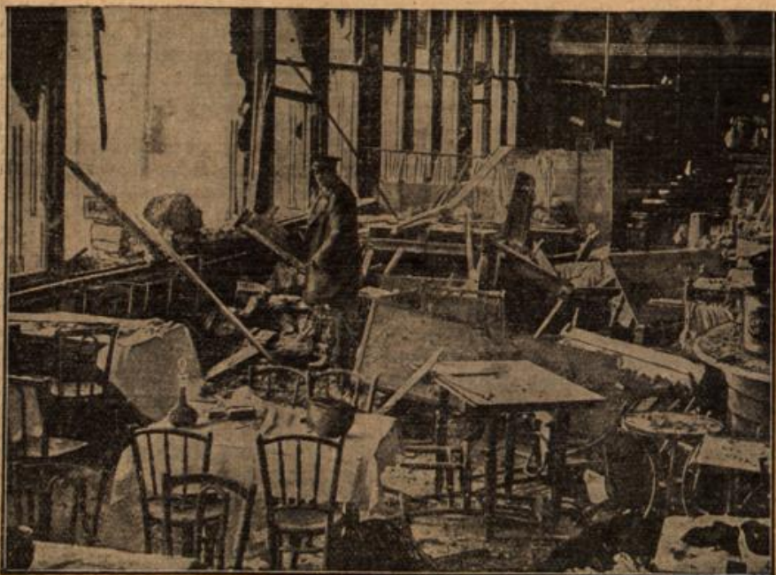
Die Wirkung der deutschen Besetzung der englischen Küste: Der zerstörte Speisesaal des Grandhotels in Scarborough.

Zwischen Zwangorod und Lodz liegen heute Wälder, die immer hinderlich gefährlich sind. Wir hatten herausbekommen, daß ein Förster im Walde eine heimliche Verbindung mit dem Feinde hielt; nun galt es, die elende, russische Besatzung zu stürmen. Es hieß „Freiwillige