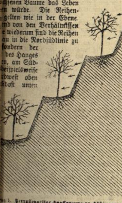
Abbildung 1. Terrassenartig Anpflanzung an Abhängen. Die Bäume sind der Richtung der Pflanzung auf die Bäume zurückgemessen.