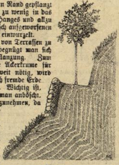
Abbildung 3. Trodenmauer zur Befestigung der Böschung.

Als beste Baumform empfiehlt Janson den Halbstamm, da er die Ernte erleichtert und die