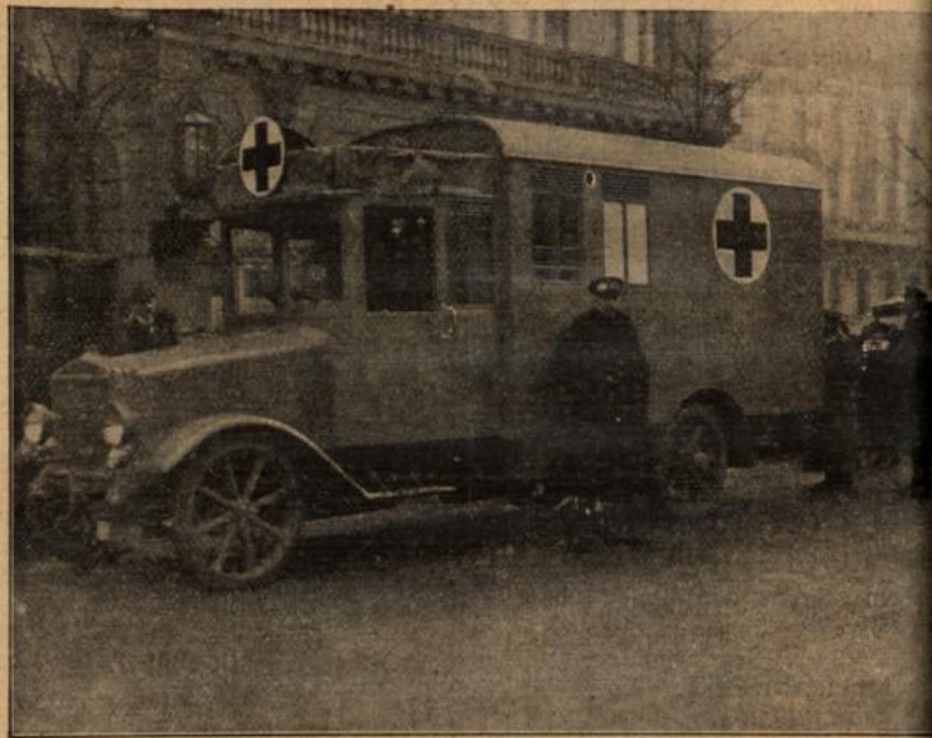
Das neue Lazarett-Automobil.

Da kroch er heran, auf allen Vieren auf dem Bauch rutschend, jämmerlich anzusehen wie nur ein halberfrorenes, hungerntes Vieh anzusehen sein konnte. Er lockte den kleinen, weißen Terrier