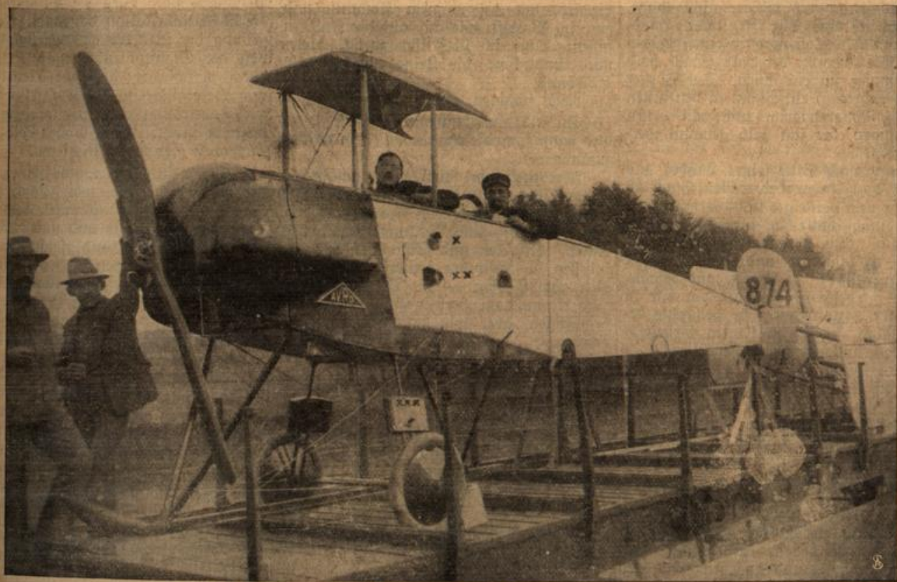
X und XX zeigen die Treffer an, die das Flugzeug zum Landen zwangen.

lieblosen. Noch einmal machte er seine Kunststückchen, die wir ihm im Schützengraben beigebracht hatten, ehe er mit uns auf und davon ging. Ich nahm ihn an die Leine, denn er war bei unserer Pflege fest geworden, von dem Elend, das er in jener Bivaknacht darstellte, war nichts mehr zu bemerken. Auf den Feldern interessierte ihn das Wild, im Walde war er kaum zu halten. Alle Augenblicke nahm er eine andere Bitterung. Wir gingen schweigend, uns nur flüsternd verständigend.