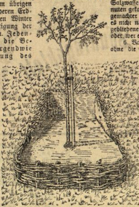
Abbildung 4. Pflanzweise mit Fächelbestimmung.

Zur Wartung der Ziege. Ziege in Studdiehställen uniergeb