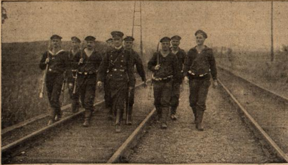
Abpatrouillieren einer Bahnstrecke bei Antwerpen durch eine Marineabteilung.