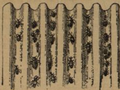
Abbildung 6. Innere Seite eines Wellpappgürtels mit darin gefangenen Apfelblütenstechern.

Wenn Pferde mit dem einen Fuß den anderen streichen, so kann dies verschiedene Ursachen haben, wie z. B. schlechter Bau der Beine, Gelenkrankheiten, vorhergegangene allgemeine Krankheiten, Ermüdung, Schwäche usw. In den meisten Fällen kommt jedoch der Fehler bei solchen Tieren vor, welche falsch angespannt werden. Denn diese streifen in der Regel mit dem äußeren den inneren Fuß, d. h. das Handpferd berührt mit dem rechten den linken Fuß und das Sattel Pferd mit dem linken den rechten Fuß. Die Tiere gehen, mit den Köpfen nahe aneinander gerückt, schief neben der Deichsel her. Zum Beweise dafür, daß die falsche Anspannung die Schuld trägt, braucht man die Pferde nur einmal umzuspannen, und man wird sofort sehen, daß sie dann mit dem anderen Eisen streichen. Darum beseitigt richtiges