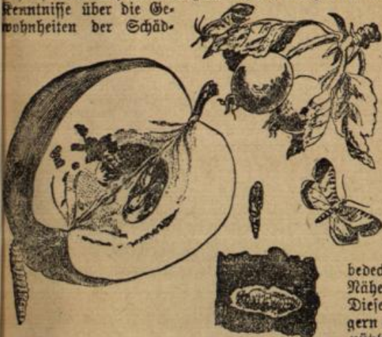
Abbildung 1. Der Apfelwickler. Falter im ruhenden und fliegenden Zustande; Puppe, darunter eingelagerte Raupe; an der Frucht, am Gespinnsfaden hängend, erwachsene Raupe.

Es ist an der Zeit, die Winterruhe zur Umschau im Obstgarten zu benutzen, die Generalreinigung der Stämme mit Bürste und Kraper vorzunehmen und hiernach den Kalkmisch zu geben. Damit trifft man auch manchen Vertreter der beiden Sünder, die hierunter geschildert werden sollen, und die sich, wie verschiedene andere Schädlinge, hinter Rindenrisse um Winterschlaf zurückziehen. Die Winterruhe ist aber auch die beste Zeit, sich die nötigen Kenntnisse über die Gewohnheiten der Schäd-