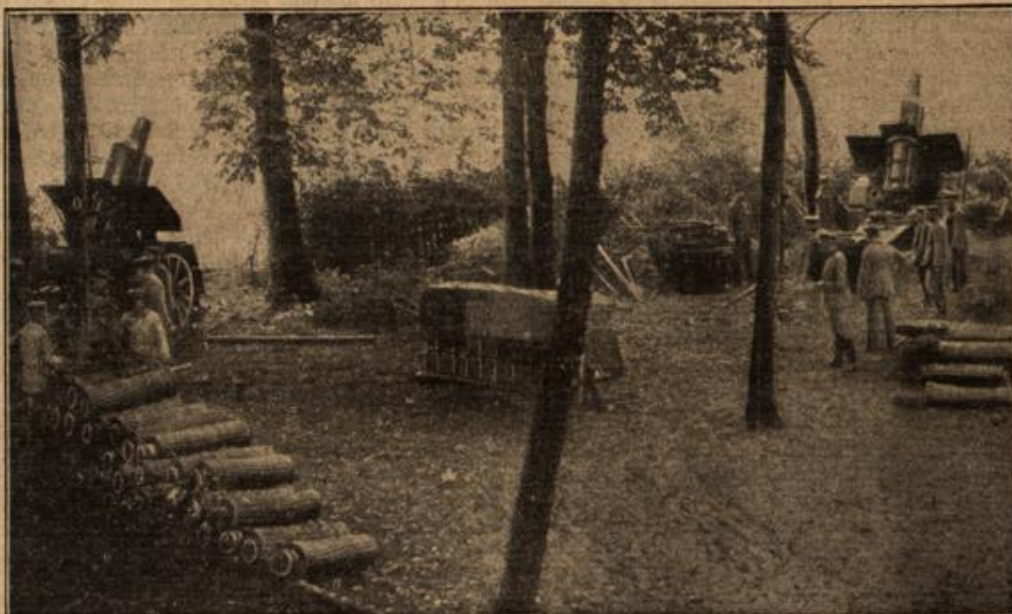
Deutsche Mörsergeschütze bei Verdun.

ängstliches Erblassen huschte auch jetzt wieder über ihr weiches Gesicht! Es kam ein Gefühl über sie, als müsse sie sich dieser Liebe langsam zu schämen beginnen. Gleichzeitig begann der Wind lebhafter zu gehen, so daß in den Blättern der früh, allen Saft hingegeben habenden Linden ein leises, empörtes Rauschen begann. Ueber sie? Sie schrak zusammen und sah ängstlich umher. Aber es war nichts zu erpähen, das sie beruhigen hätte dürfen. Der Gutshof lag still, ja verlassen da. Die Kinder hörten artig zu. Die schöne Herrin hatte Ungeduld und Empörung über das Zuspätkommen des Gemahls vergessen. — Frieden, wohin man auch sah — keine Spur von dem tobenden, blutigen Weltkampf, der alles aus den Fugen zu brechen veruchte. Nur ihre Liebe nicht. Da war sie schon wieder bei dem alten Punkt angelangt, konnte sich nun auch nicht so schnell davon losreißen, sondern barg das Gesicht in den Händen und sann nach. — Wann hatte diese Liebe begonnen?