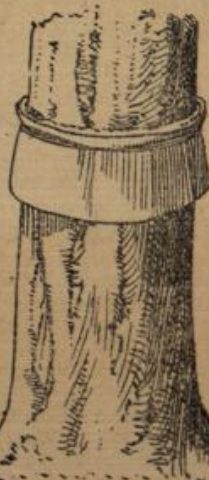
Abbildung 2. Fanggürtel aus Pappe, umgelegt.

Die Bekämpfung des Schädlings ist, soweit möglich, durch Einsammeln und Verbrennen der befallenen Knospen durchzuführen. Auch soll man in der Morgenfrühe der Apriltage durch kurze, plötzliche Stöße die Bäume schütteln und die noch erstarren Käfer auf untergelegte Tücher fallen lassen. Ebenso läßt sich mancher Käfer vernichten, wenn man um diese Zeit die Bäume abends abklopft, nachdem man zuvor etwa 1 m über dem Boden grobe Leinwandstreifen mit Bindfaden um den Stamm befestigt und dicht darüber wie bei der Frostspannerbekämpfung einen Klebgürtel (einfaches Delpapier, mit Leim bestrichen) angebracht hat. Die Käfer verkrüppeln sich, durch den