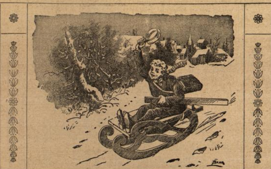
Ein „fahrender Schüler“. Praktische Verwendung des Tafel-Kurven-Lineals und des Reißbretts zu einem Schlitten.

Eine Wrangel-Anekdote. Als Wrangel im Jahre 1849 die preussischen Truppen in Schleswig-Holstein kommandierte, wohnte er einige Zeit in der Stadt J. im „Hotel zur Börse“. Die Besitzerin dieses Gasthofs war eine ältere Witwe, eine kluge, stadtbekannte Frau, schlagfertig und witzig! Die kannte auch ganz genau das Sprichwort, daß auf einen groben Schlag ein grober Keil gehört. Wrangel stand sich gut mit ihr und freute sich häufig über ihre guten, wenn auch zuweilen derben Antworten. Als er nun im Jahre 64 wieder in die Stadt J. kam, nahm er in demselben Hotel Quartier und wurde bei seinem Eintreffen an der Tür von der inzwischen ganz weiß gewordenen, aber noch rüstigen und strichen Wirtin empfangen. — „Na, du alte Hege, lebst Du auch noch?“ war Wrangels Begrüßungsfrage, auf welche sofort die Gegenfrage erfolgte: „Na, Du alter Spitzbube, kommst Du auch mal wieder ins Land?“ — Lachend und in bester Laune reichte Wrangel ihr die Hand, und die alte Freundschaft war wieder hergestellt.