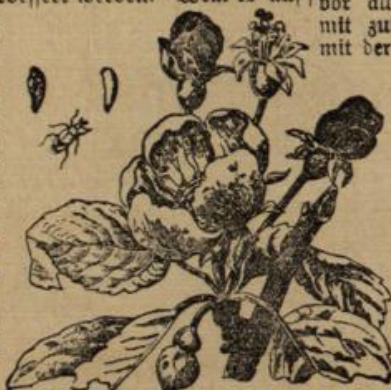
Abbildung 5. Der Apfelblütenstecher. Käfer, Raupe, Puppe.

Auch hier ist auf Rindenpflege und Kalkanstrich noch besonders zu verweisen. Solche Arbeit ist noch zur Winterzeit angebracht. Auch die rechte Düngung ist nicht zu vergessen, denn in der guten Ernährung der Bäume liegt ein gutes Abwehrmittel gegen die Schmarotzer jeder Art. Überall sollte man sich aber darüber klar werden, daß der Einzelne in seinem Vorgehen ziemlich machtlos und nur der gemeinsame Kampf ausschlaggebend ist.