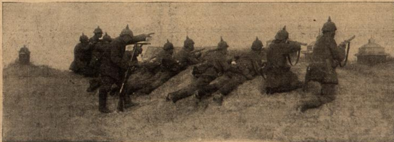
Deutsche Truppen im Schutz der Dünen bei Ostende.

Wir bringen heute zwei interessante Bilder vom westlichen Kriegsschauplatz. Oben sehen wir eine Infanterieabteilung im Schutze der Dünen bei Ostende im Anschlag gegen einen für den Beschauer allerdings unsichtbaren Feind. Es ist dies überhaupt eine Beobachtung, die man in diesem Kriege auf feindlicher wie auf unserer Seite gemacht hat, daß alle Truppen sich fast so in Deckung bringen, daß sie dem Gegner schier unsichtbar bleiben, bis nach ihrer Meinung die Stellung gegenüber sturmreif, wie der Fachausdruck lautet, geworden ist. Das untere Bild zeigt Soldaten unserer Geniekorps, die dabei sind, ein Mastfernrohr, das fahrbar ist, aufzustellen, um von seiner Spitze aus die feindlichen Stellungen zu erkunden. Das fahrbare Mastfernrohr hat sich in Terrains sehr nützlich erwiesen, wo keine natürlichen Erhöhungen, keine Bäume und dergleichen vorhanden waren.