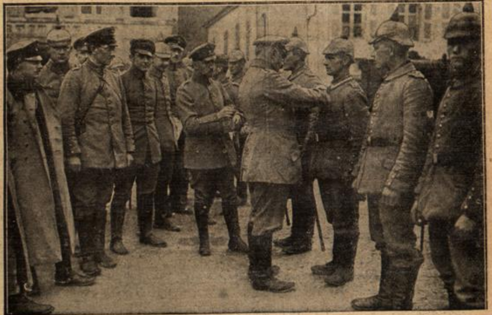
Tapfere Kämpfer von Soissons erhalten das Eiserne Kreuz.

legenheiten sogar mit Schwung von den Lippen. Aber tiefer darüber nachgedacht, oder gar etwas dabei empfunden — ich glaube — das haben sicher nur ganz wenige. Das rechte Verständnis und Empfinden lernten wir erst in den ersten