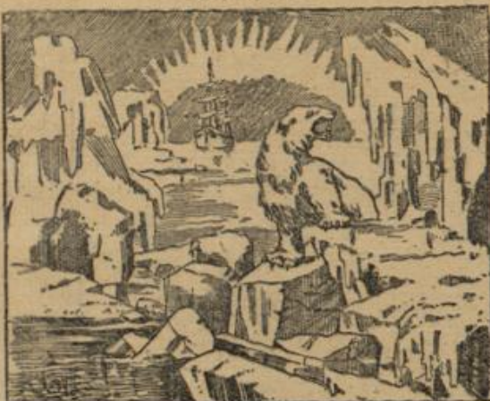
Wo ist der Nordpolfahrer?