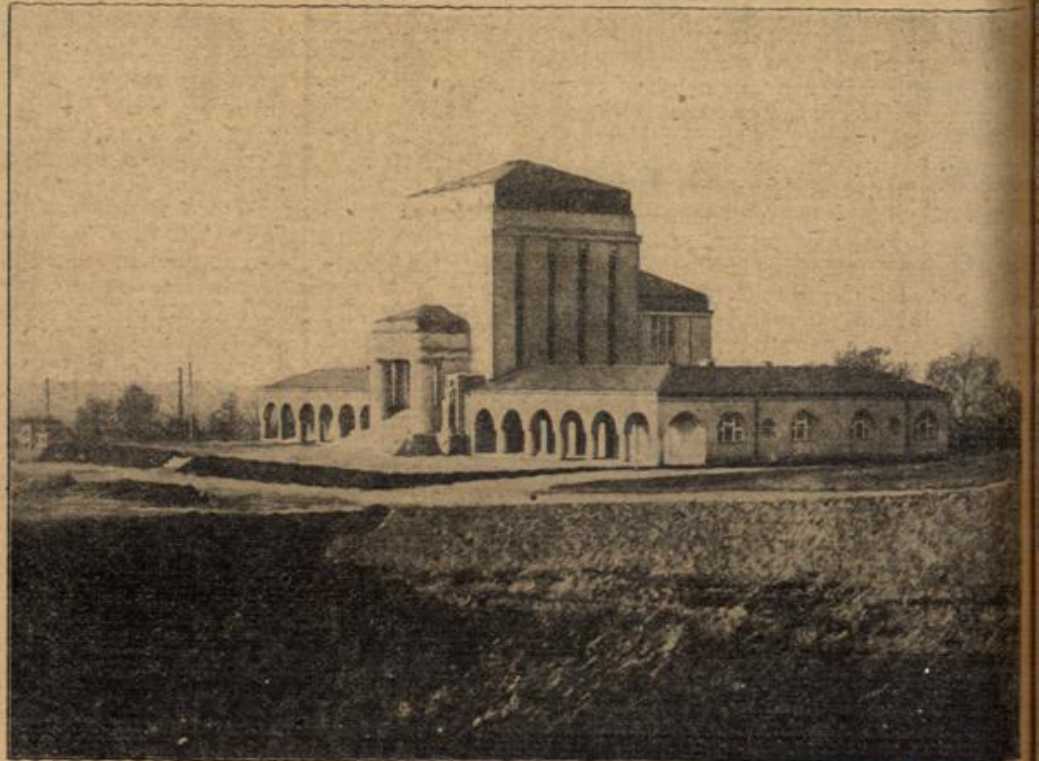
Das erste österreichische auf dem Nonstranzberge bei Reichenberg kürzlich eröffnete Krematorium.

„Sollen Sie ja auch gar nicht! Aber es gibt auch noch andere