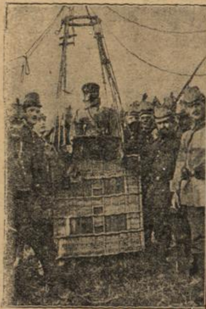
Aufstieg eines deutschen Zettelballons, in dessen Korb eine Strohpuppe gestellt wurde, um feindliche Züge zu täuschen.

Nun antwortete sie doch ein wenig erleichtert auf. Lächelnd grüßte er nochmal, und leicht erröthend dankte sie.