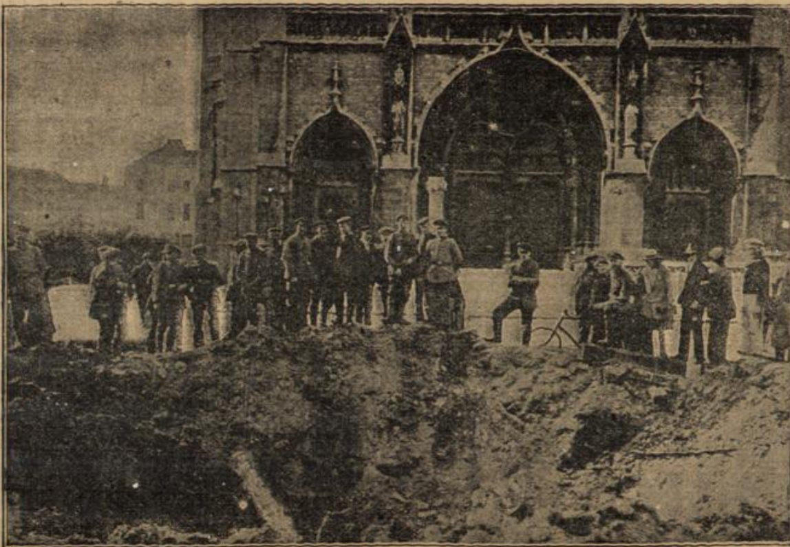
Die planvolle Beschießung der Kathedrale von Ostende durch englische Schiffsgechühe. (Mit Text.)

„Darüber habe ich, offen gestanden, bis jetzt nicht nachgedacht,“ sagte er lächelnd.